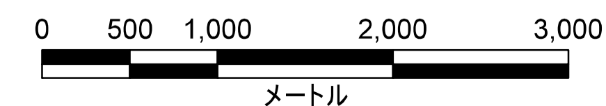
津波災害警戒区域 位置図

この地図の作成に当たっては、国土地理院長の承認を得て、同院発行の数値地図(国土基本情報)電子国土基本図(地図情報)を使用した。(承認番号 平29情使、第1125号)