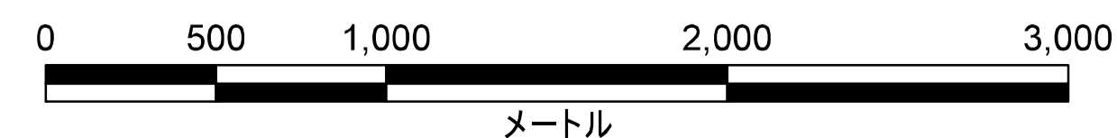
津波災害警戒区域 位置図

この地図の作成に当たっては、国土地理院長の承認を得て、同院発行の数値地図(国土基本情報)電子国土基本図(地図情報)を使用した。(承認番号 平29情使、第1125号)