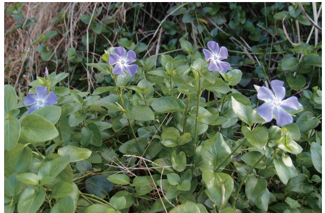
■ツルニチニチソウ 要注意 p.74