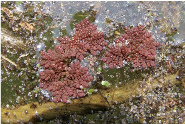
■外来アゾラ属 要対策 p.43