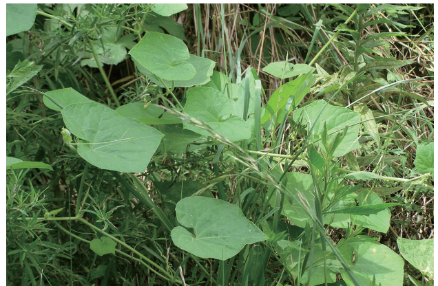
■アレチウリ 要対策 p.51