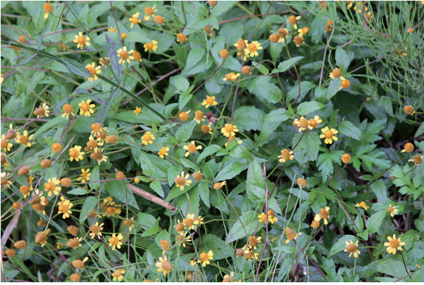
■ヌマツルギク 要対策 p.59