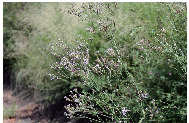
■アレチハナガサ 要対策 p.57