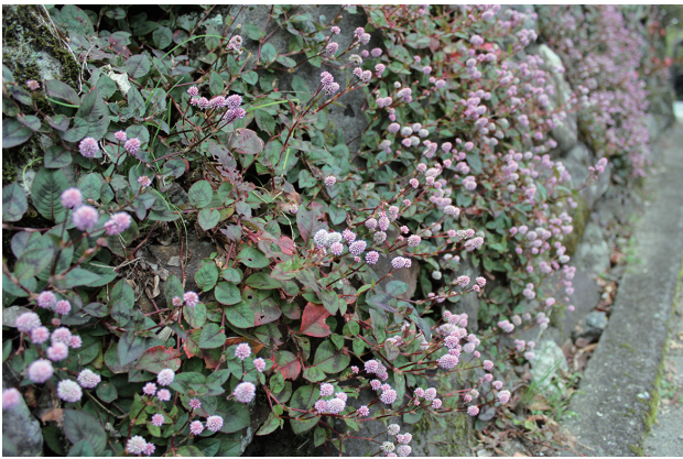
■ヒメツルソバ 要注意 p.74