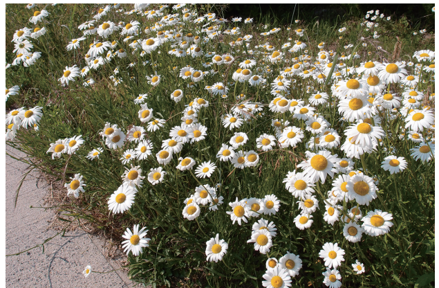
■フランスギク 要注意 p.75