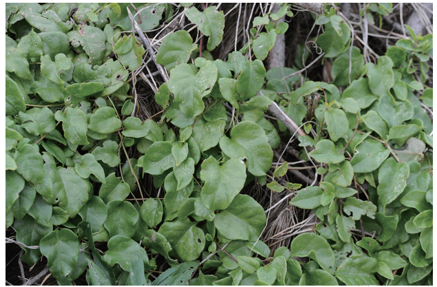
■アカザカズラ 要注意 p.74