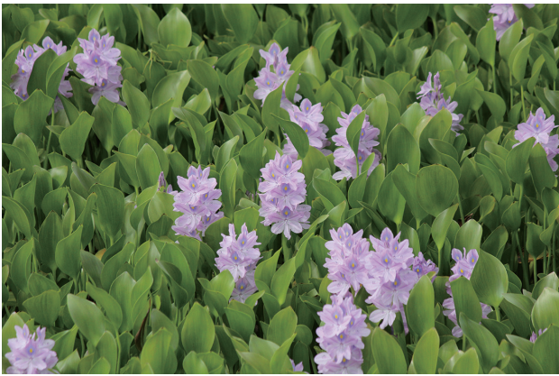
■ホテイアオイ 重点対策 p.25