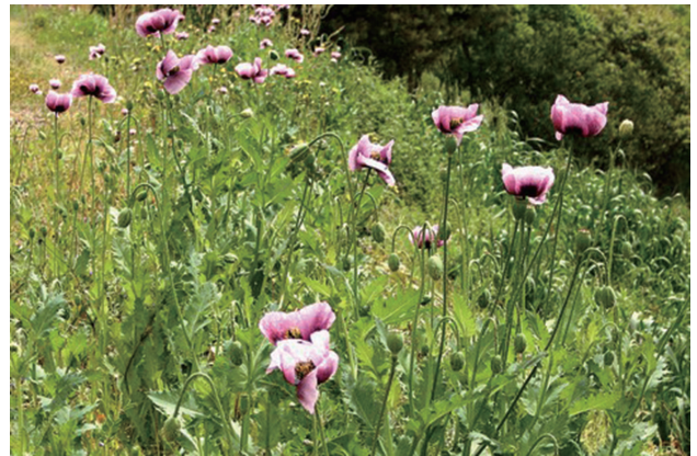
■アツミゲシ 要対策 p.47