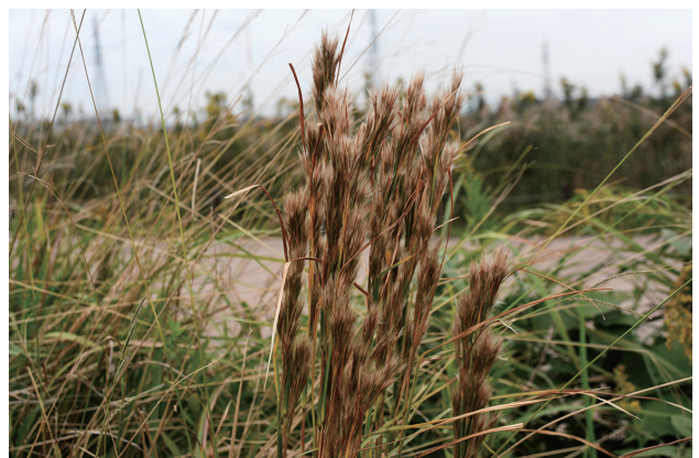
■フトボメリケンカルカヤ 要注意 p.75