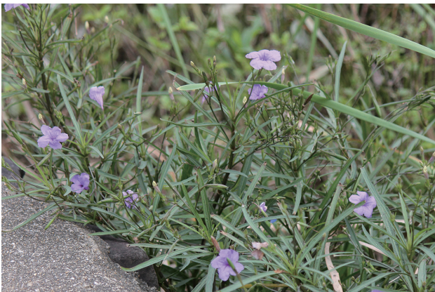
■ヤナギバルイラソウ 要注意 p.75