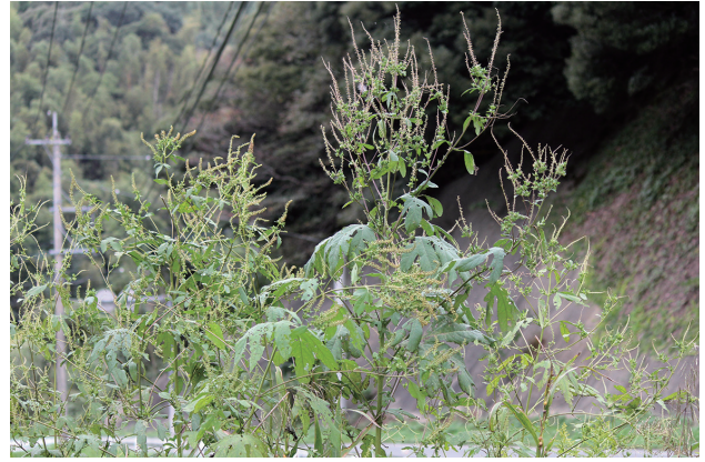
■オオブタクサ 要対策 p.59