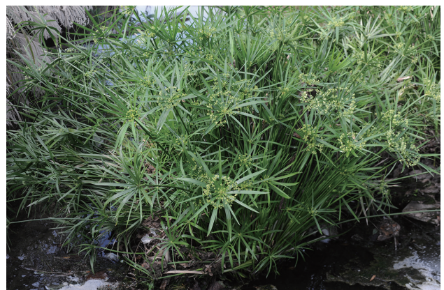
■シュロガヤツリ 要対策 p.71