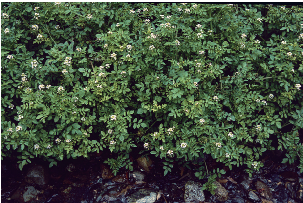
■オランダガラシ 要対策 p.48