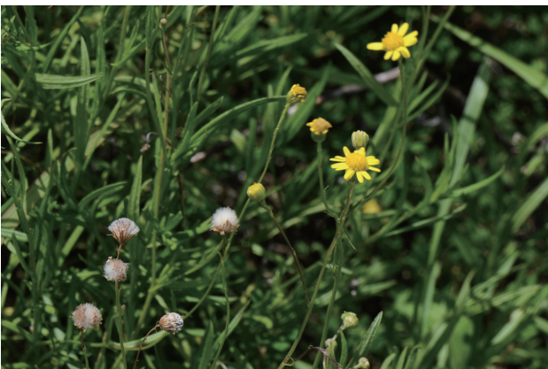
■ナルトサワギク 重点対策 p.24