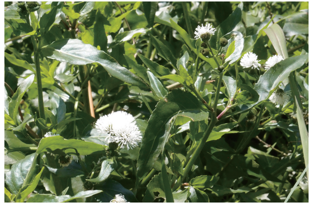
■ミズヒマワリ 重点対策 p.24