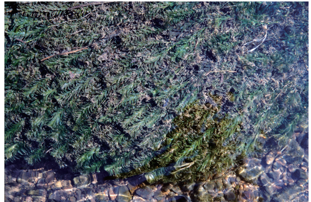
■オオカナダモ 要対策 p.63