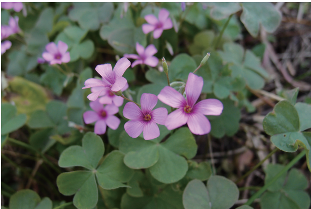
■ベニカタバミ 要注意 p.74