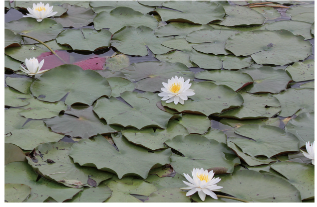
■園芸スイレン 重点対策 p.22