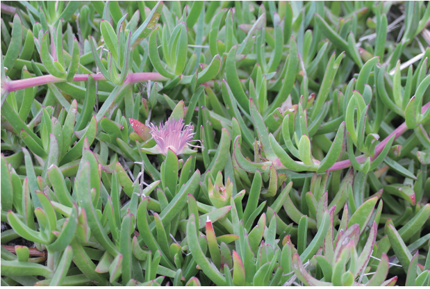
■バクヤギク 重点対策 p.22