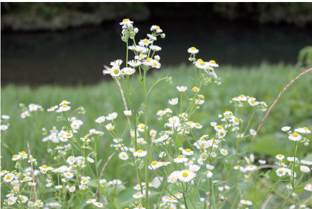
■ヒメジョオン 要対策 p.60