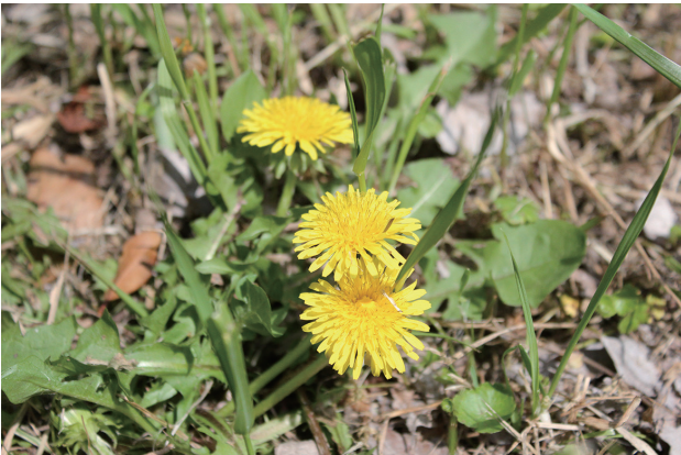
■セイヨウタンポポ 要対策 p.62