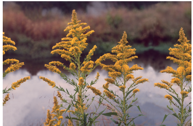
■セイタカアワダチソウ 要対策 p.61