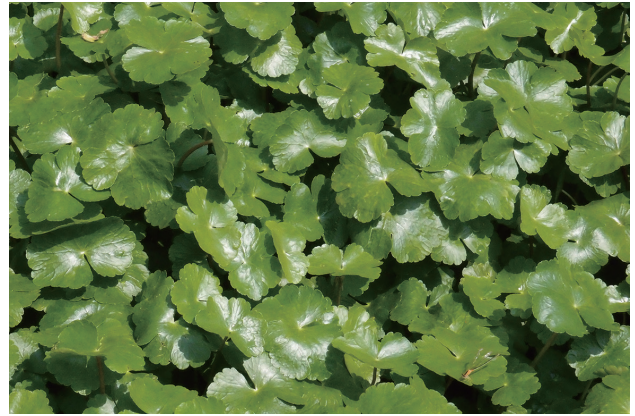
■ブラジルチドメグサ 重点対策 p.23