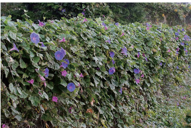
■オオバアメリカアサガオ 要対策 p.55