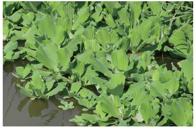
■ボタンウキクサ 重点対策 p.25