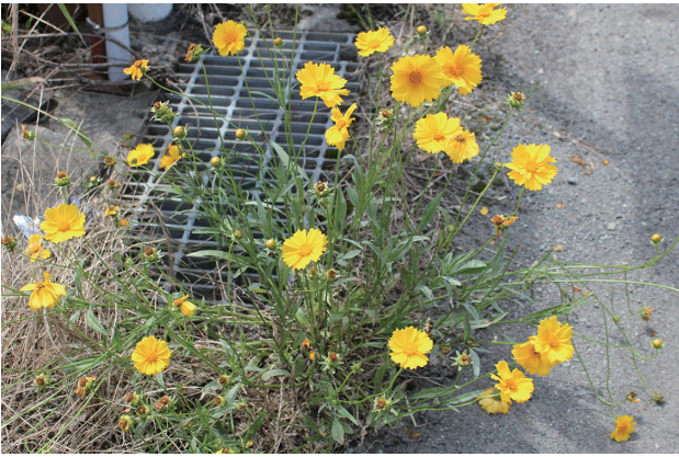
■オオキンケイギク 重点対策 p.23