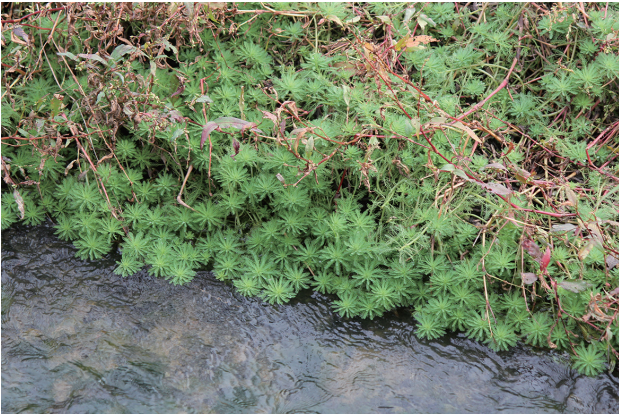
■オオフサモ 重点対策 p.23