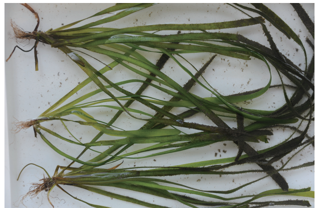
■コウガイセキショウモ 重点対策 p.24