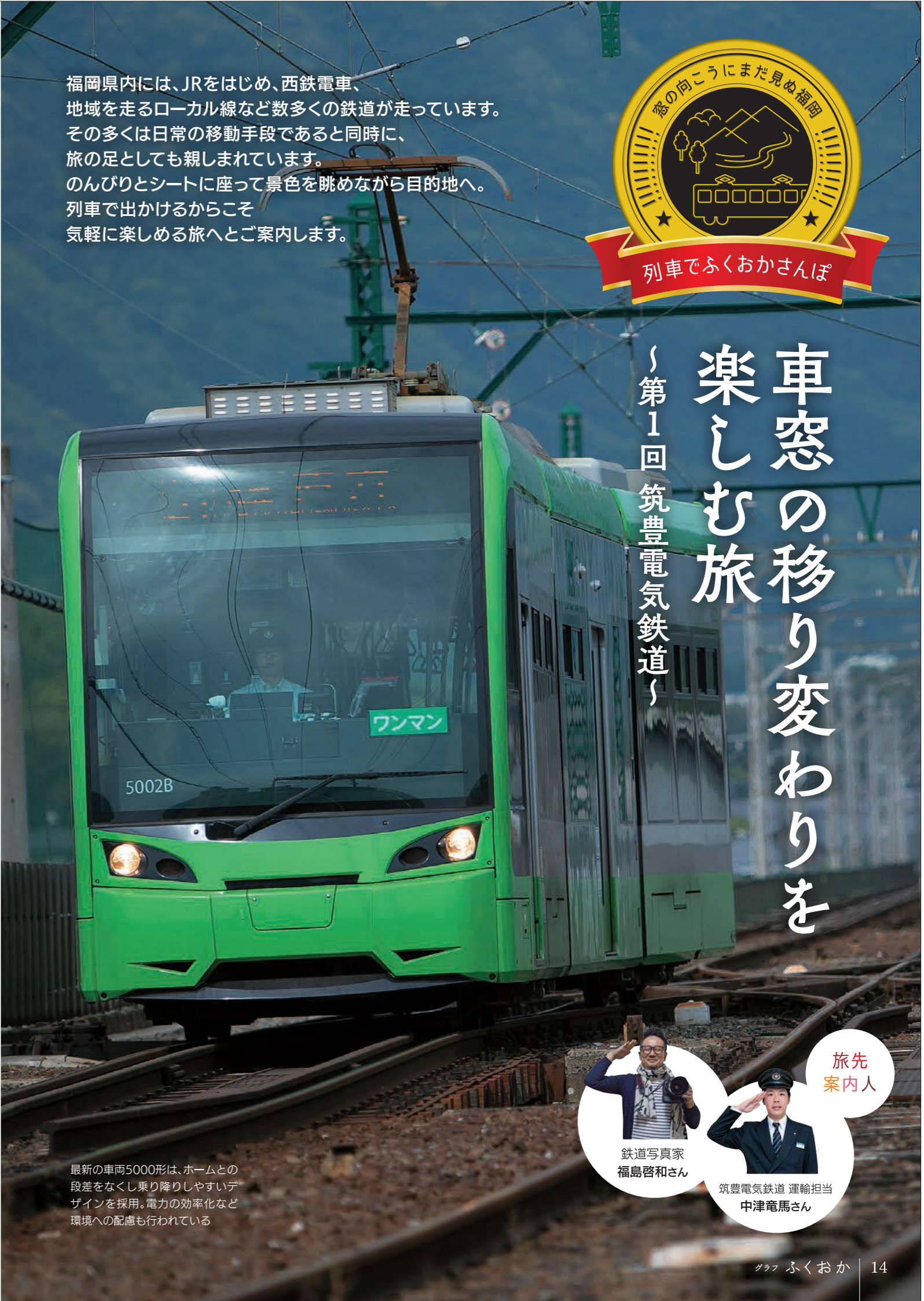
最新の車両5000形は、ホームとの段差をなくし乗り降りしやすいデザインを採用。電力の効率化など環境への配慮も行われている