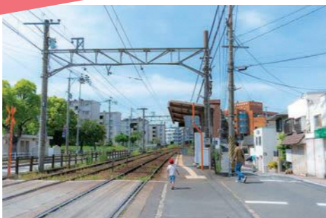
駅周辺には昔ながらの商店街もあり、おさんぽに最適