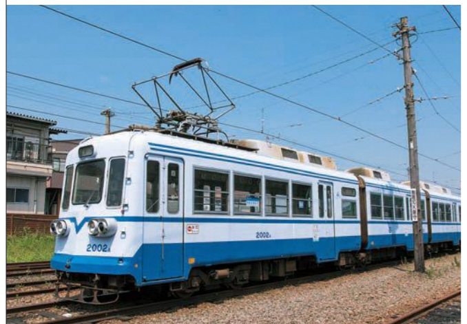
1977年から走る2000形の車両。クラシックな前照灯、前面の3枚窓などが特徴で、現在は、朝夕のラッシュ時のみ走行している