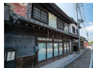
街道の面影を残す周辺の町並みは散策コースに最適

江戸時代、小倉と長崎を結ぶ長崎街道の筑前六宿の宿場町として栄えた木屋瀬の本陣跡に建つ白壁の博物館。その本陣跡に建つ記念館には、歴史への旅体験をテーマとした「みちの郷土資料館」と芝居小屋風の多目的ホール「こやのせ座」が併設されています。