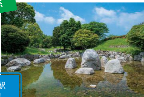
大小の飛び石が配された親水空間