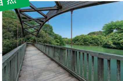
もみじ谷の入江に架かる、37メートルの木製アーチ橋で水辺散策