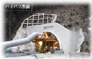
<緊急輸送道路の整備>