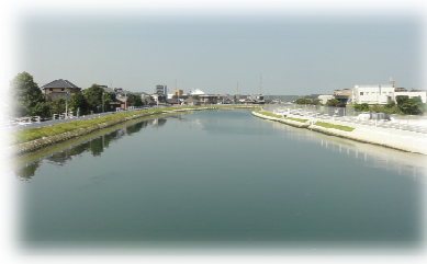
<浸水被害防止のための護岸整備>