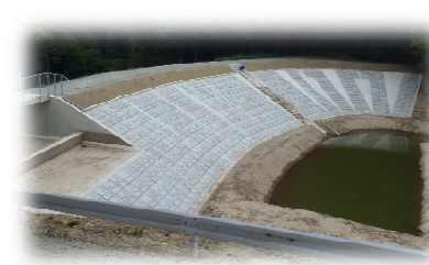
<ため池の改修工事>