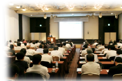
<ビジネスプラン発表会>