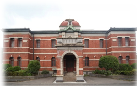
<官営八幡製鐵所 旧本事務所>