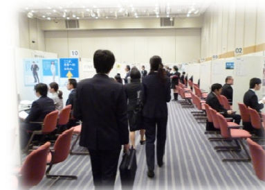
<合同会社説明会の風景>