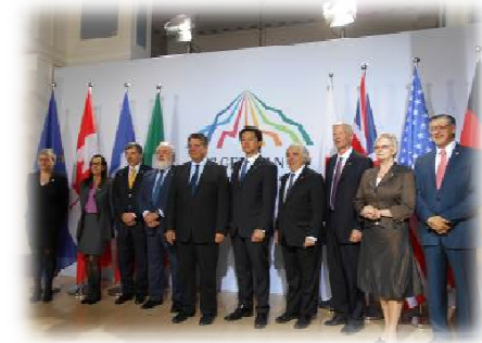
<2015 ドイツ・ハンブルク>