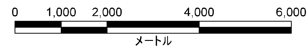
津波災害警戒区域 位置図

この地図の作成に当たっては、国土地理院長の承認を得て、同院発行の数値地図(国土基本情報)電子国土基本図(地図情報)を使用した。(承認番号 平29情使、第1125号)