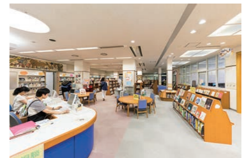
別館1階の子ども図書館