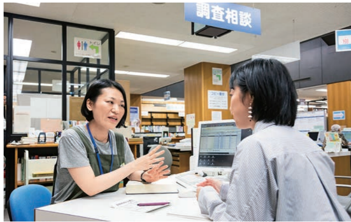
来館者のあらゆる疑問の解決をお手伝い