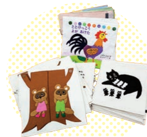
ボランティア団体が作る、 お手製の布絵本なども

図書館が企画・主 催する、絵本の読 み聞かせ会なども 定期的を実施。子 どもたちが本に親 しみきっかけづく りにも積極的に取 り組んでいる