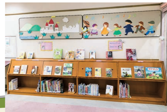
別館として独立しているので、子どもたちが のびのび過ごせる場所も魅力の一つ

図書館が企画・主 催する、絵本の読 み聞かせ会なども 定期的を実施。子 どもたちが本に親 しみきっかけづく りにも積極的に取 り組んでいる