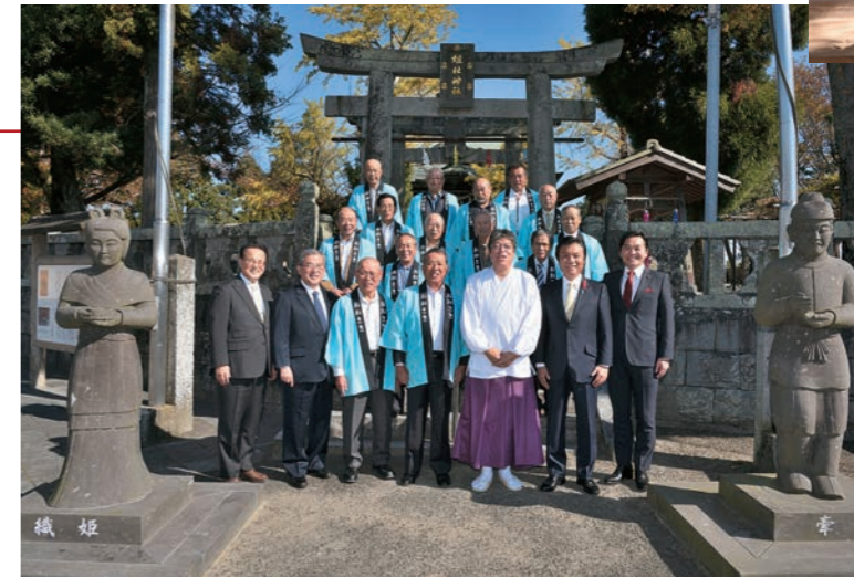
肥前国風土記にその名が記される古社。七夕伝説の織姫を祭る。東側に流れる宝満川を隔てた場所には彦星である牽牛を祭る「老松宮(牽牛社)」が鎮座