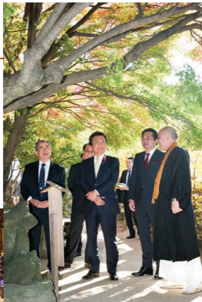
729年開創。ご本尊の如意輪観音は日本唯一の立像。普段は秘仏で、12年に一度の開帳時のみ拝観できる

境内にある「良縁くぐりかえる」。口の中をくぐることで、若返る、元気が返る、悪いことを良い方に変えるなど、ご利益があるのだとか