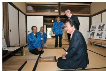
「主屋」の隣には、身分の高い貴客向けの宿泊棟「座敷」が建つ。平成27年に復元工事を終え、公開中。主屋、座敷共に「旧松崎宿旅籠油屋」として市有形文化財に指定されている