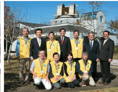
大型望遠鏡を備える天体ドーム「小郡七夕ドーム みるい星」。七夕伝説が息づく小郡市では星空を身近に感じられるよう、毎週土曜日に一般開放。知事は太陽の黒点観測を楽しんだ