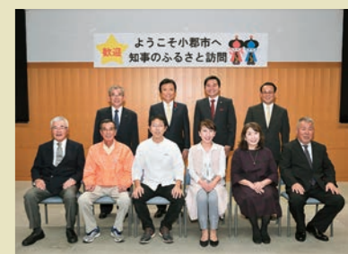
ようこそ小郡市へ 知事のふるさと訪問