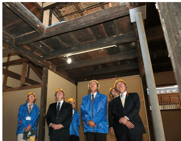
薩摩街道の宿場町として栄えた松崎宿で最大規模を誇った旅籠(旅館)。一般客向けの「主屋」には大久保利通や西郷従道らも宿泊したという記録が残る。現在、復元工事中(来年3月完成予定)