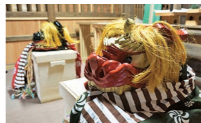
毎年8月6日から8日に実施される夏祭りでは、宮司が獅子と共に地域の氏子宅を訪れ、家内安全、無病息災を願う伝統行事「獅子追い」が行われる