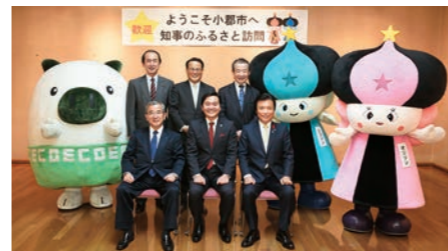
市民ギャラリーや天体ドームを備える市民の生涯学習拠点。加地良光市長から市の概要説明を受けた後、今年7月の豪雨災害の復旧対策などについて意見交換を行った。写真右は市の観光大使「オリリン」と「ヒコリン」