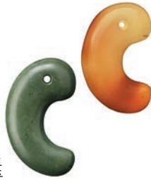
(左) 碧玉製勾玉 (松江市教育委員会) (右) メノウ製勾玉 (島根県教育庁埋蔵文化財調査センター)

シルクロードを通じて、地中海沿岸からも運ばれた古墳時代の宝玉。その輝きに魅せられた人々は、首飾りや腕輪に加工して着飾りました。多様な色彩を放ち、今日も色あせない古代の輝きを、ぜひご覧ください。