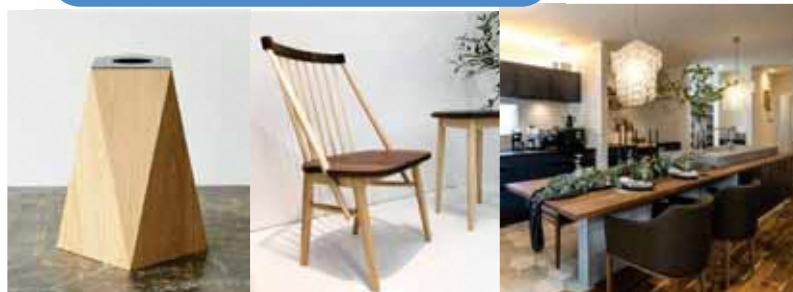
(有)丸惣 × アハト(株)