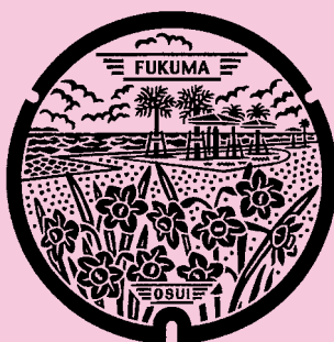
福津市(旧福間町) 旧福間町の町花「スイセン」と海