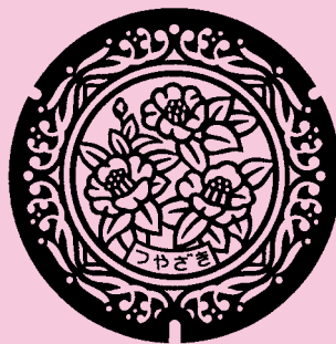
福津市(旧津屋崎町) 旧津屋崎町の町花「ツバキ」と 玄界灘の波