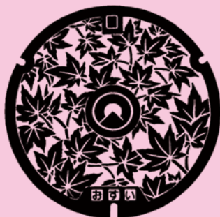
糸島市 旧前原市の市木「カエデ」