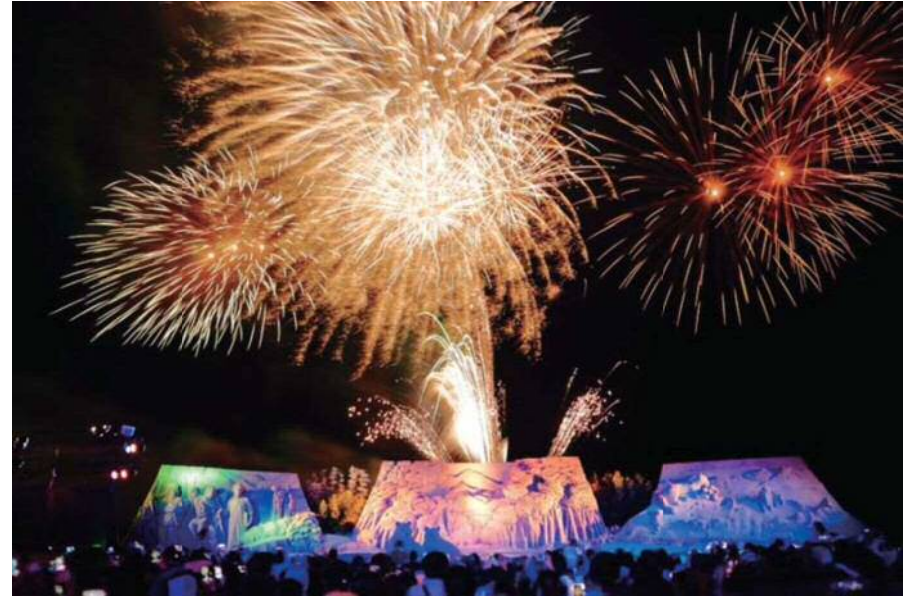
芦屋町 あしや砂像展 10月中旬～11月上旬