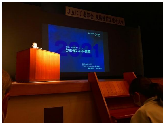
スマート農業の講演会