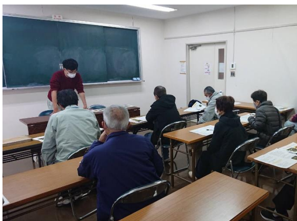
「甘うい」栽培管理の講習

普及指導センターでは、高品質な「甘うい」を多くの消費者に届けられるよう、関係機関と連携して、安定生産に向けた技術支援を継続していきます。