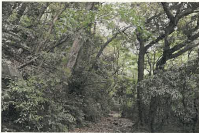
尺岳山麓のシイ・カシ二次林