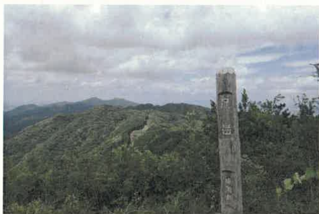
尺岳山頂から皿倉山を望む