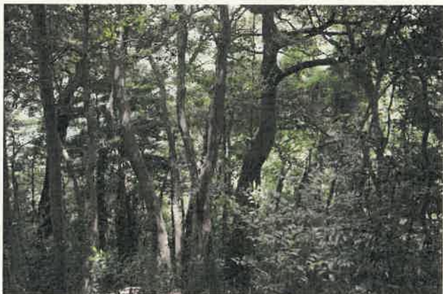
稜線部のシイ・カシ二次林