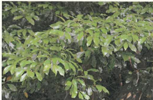
タブノキ (クスノキ科)