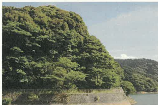
シイ・カシ二次林と落葉樹二次林