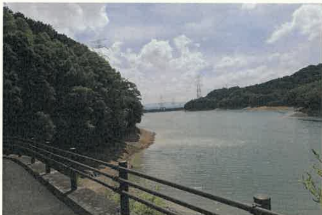
白木橋から貯水池を望む