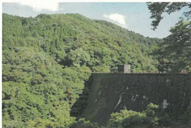
堰堤と周辺の森林