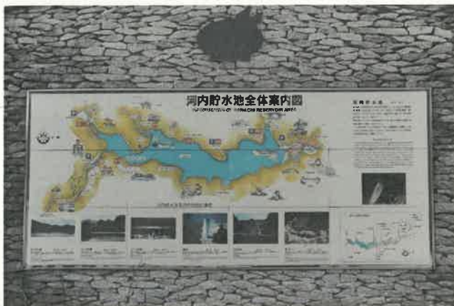
河内貯水池 全体図