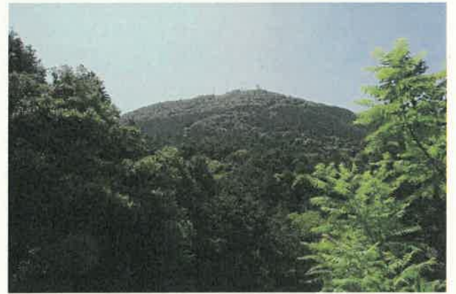
皿倉山中腹より頂上を望む