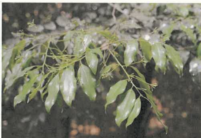
ヤブニッケイ (クスノキ科)