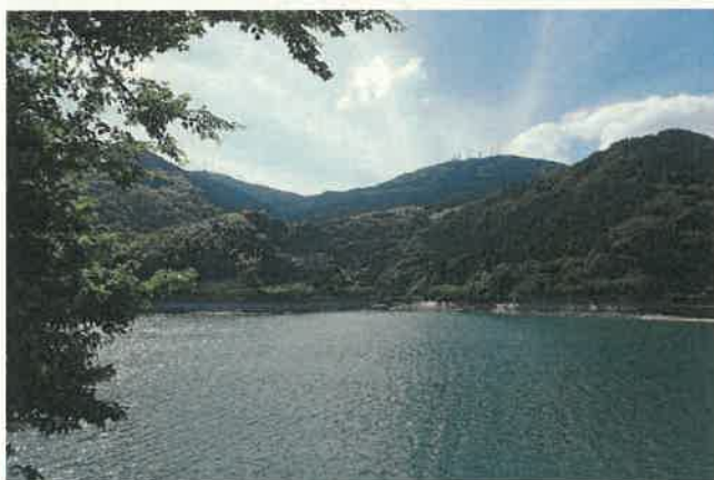
河内貯水池から皿倉山を望む