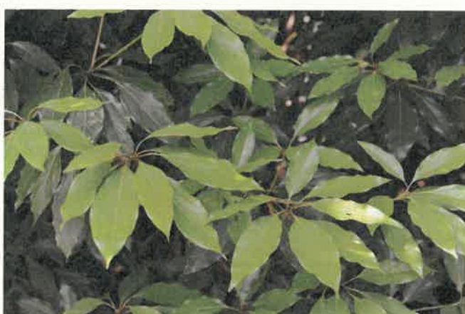
シロダモ (クスノキ科)