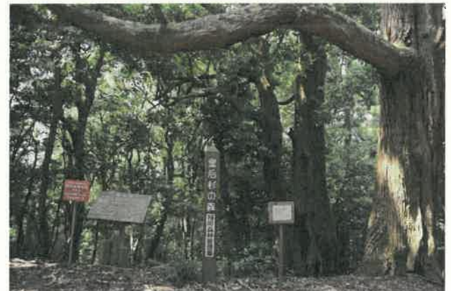
スギ巨木林 (皇后杉)