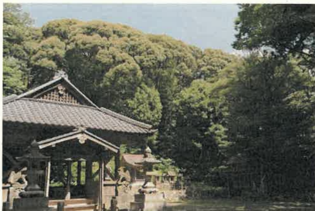
尺岳神社とシイ・カシ二次林