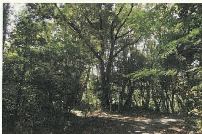
湖畔域の常緑落葉混交林