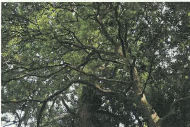
カゴノキ (クスノキ科)