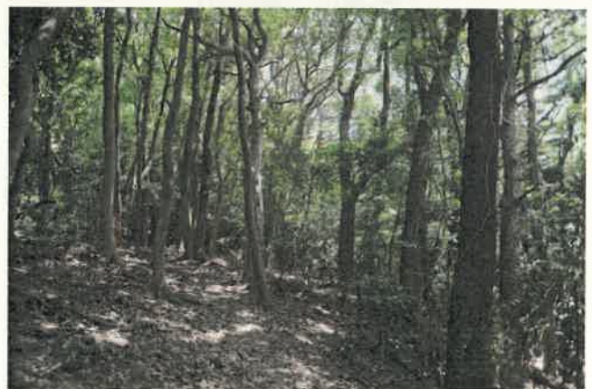
稜線部のタブノキ・ヤブニッケイ二次林