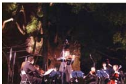
<大楠コンサート（築上町）>