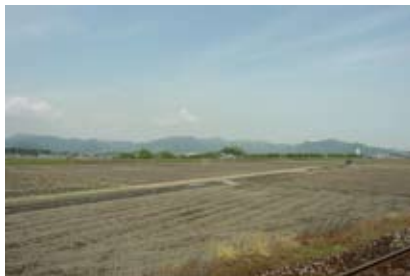
<平成筑豊鉄道から 北豊連山への眺望（行橋市）>

幹線道路や鉄道の車窓から眺望できる平地部から丘陵地、山並みへと自然が移り変わる景観を守るために、背景となる自然景観への連続性に配慮した景観づくりを進めていきます。