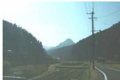
<祓川沿いから 北豊連山への眺望（みやこ町）>