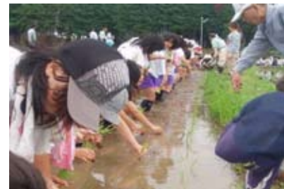
<小学生の田植え体験（行橋市）>