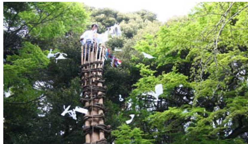
<等覚寺の松会（苅田町）>