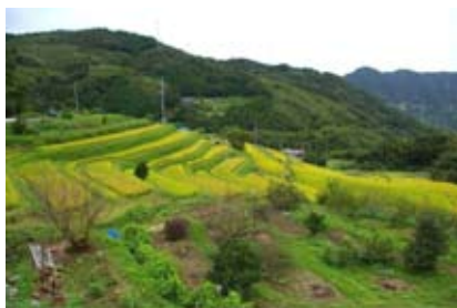
<等覚寺の棚田（苅田町）>

こうした人々の暮らしが形づくるなりわいの景観を、担い手の育成や地域住民やNPO等との連携による棚田の保全再生や耕作放棄地の活用、特産品のブランド化等により、守り育てます。