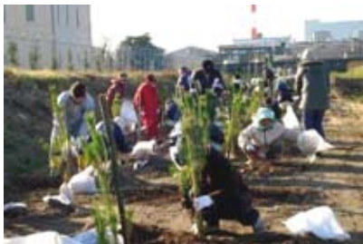
<植樹の取り組み（吉富町）>