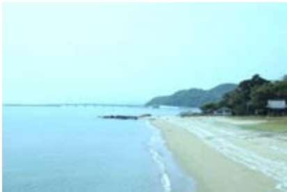
< 葦島海岸からの眺望（行橋市） >

そのため、地域住民やまちづくり団体等と協働して視点場からの景観を絵になる眺望景観として守り育てます。