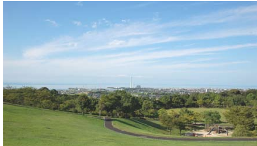
<天地山公園から豊前海への眺望（豊前市）>