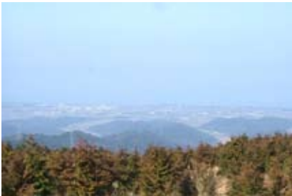
< 国見山からの眺望（築上町） >