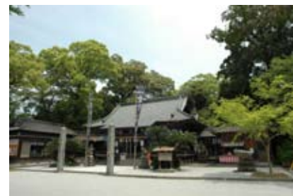
＜金富神楽の舞台 金富神社（築上町）＞