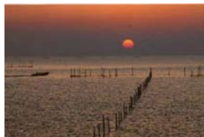
<朝日が昇る豊前海（行橋市）>