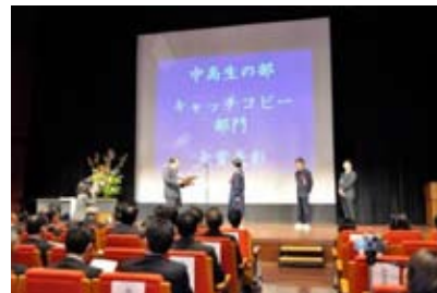
<福岡県景観文化展表彰式>