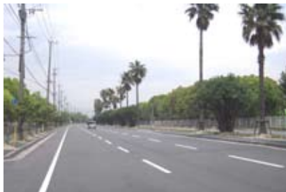
<市街地内の道路（苅田町）>

また、地域の身近な道路においては、花壇や街路樹の手入れや歩道の清掃活動等を地域住民や企業等が主体となって進めていきます。