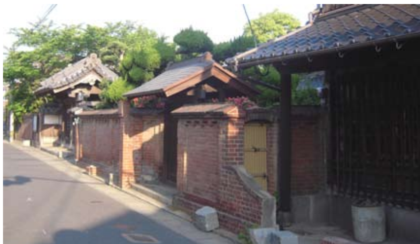
<近世の中津街道（行橋市）>

京築地域で培われてきた歴史景観の価値を再評価し、その価値を広く共有することで、将来にわたって歴史景観を守り育てるとともに、市街地内の良好な沿道景観を創っていきます。