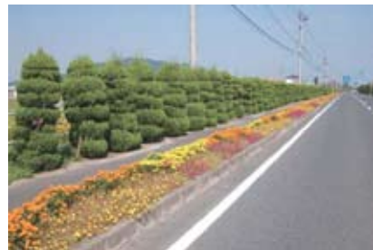
<良好に維持されている道路（行橋市）>