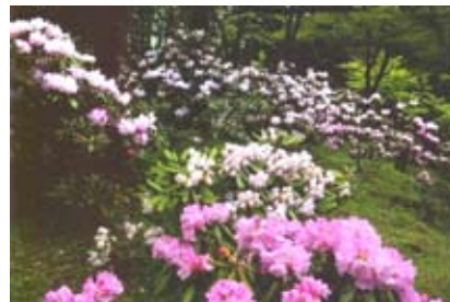
<ツクシジャクナゲの群生（豊前市）>