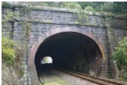
＜石坂トンネル（みやこ町）＞

こうした地域に点在する歴史的資源の中で、地域の景観を特徴づけているもの、地域で親しまれているものは、京築地域共有の財産として認識し、地域住民やNPO等の様々な主体が協働して、その保全に努めるとともに、地域に眠っている歴史的な由来や言い伝えを掘り起こし、景観づくりに活かしていきます。