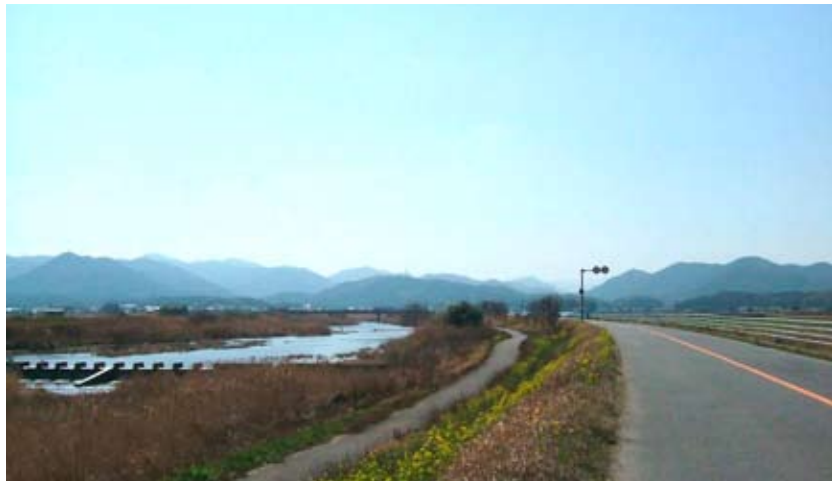
<今川から北豊連山への眺望（みやこ町）>

大地形を望む眺望景観を地域の象徴的な景観として位置づけ、守り育てていくこと、さらには大地形で構成される景観のつながりを守り、維持していくことで、古代より守られてきた雄大な自然景観を将来にわたって引き継いでいきます。