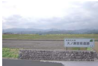
＜大ノ瀬官衙遺跡（上毛町）＞