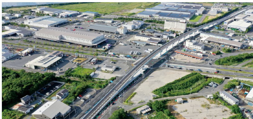
① 一般県道 新北九州空港線 苅田工区 (苅田町)