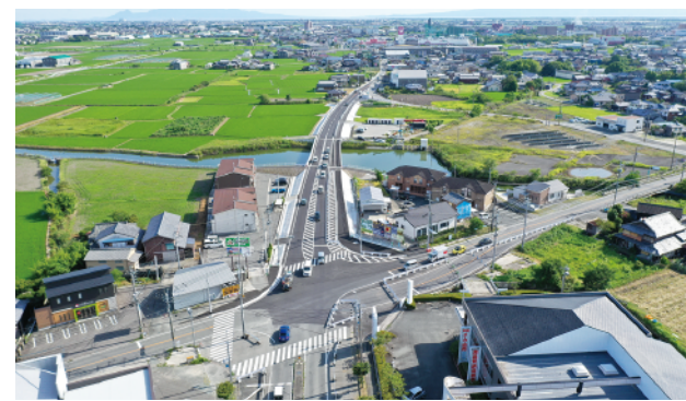
④ 一般県道 鐘ヶ江酒見間線 大橋工区 (大川市)