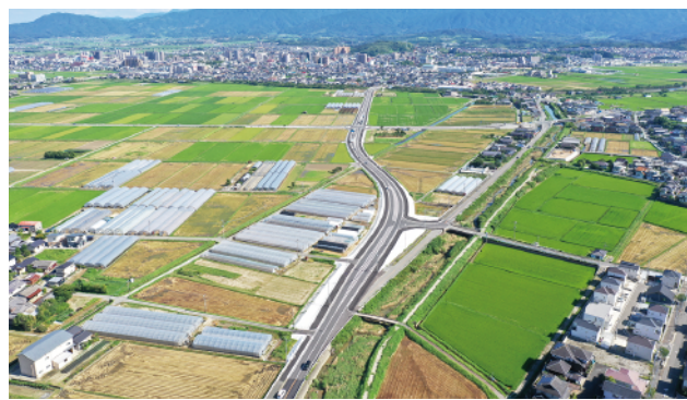
② 一般県道 船越前原線 新田工区 (糸島市)