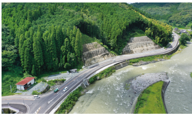
③ 主要地方道 八女香春線 長野工区 (八女市)