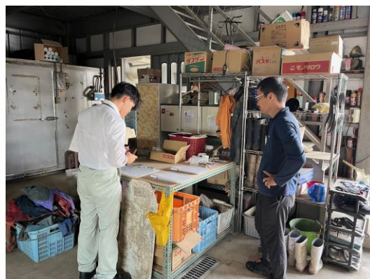
県GAP現地審査の様子