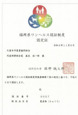
ワンヘルス認定証

普及指導センターでは、信頼されるきゅうり産地の更なる発展に向けて、部会員の規模拡大と新規栽培者の栽培及び経営安定に向けた支援を行っていきます。