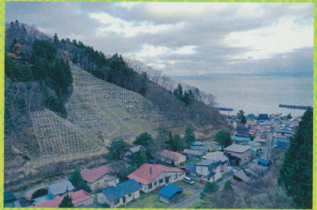
【令和3年度写真コンクール最優秀賞】 「集落を守る治山事業」 北海道函館市 山本竜太郎