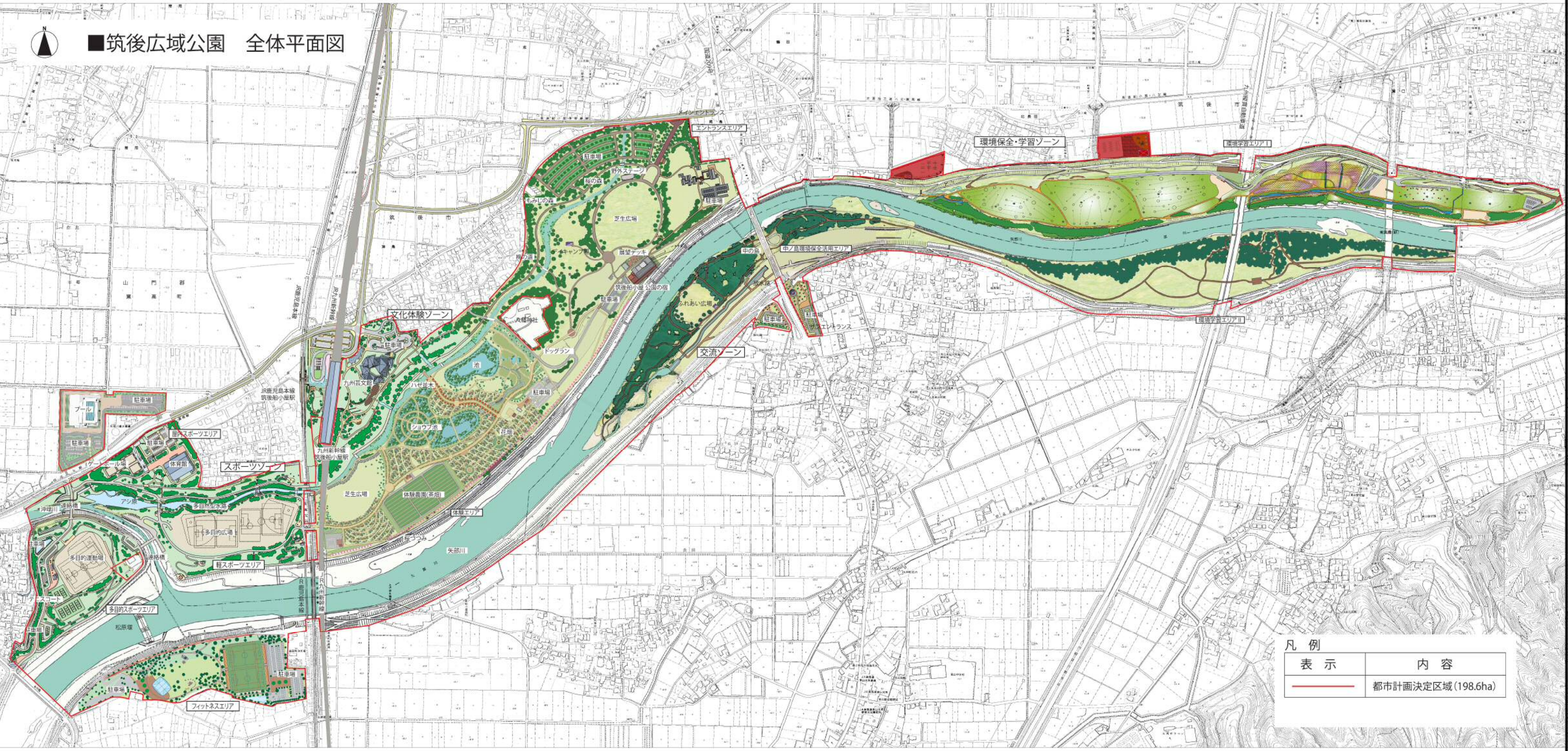
■筑後広域公園 全体平面図