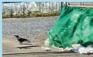
動物に荒らされたごみ