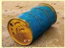
燃えやすい物質が入ったドラム缶