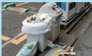
あふれかえったごみ箱