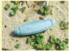
有毒な鉛が含まれている漁具