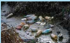
ポイ捨てされたごみ

街でのごみのポイ捨てのほか、ごみ箱からあふれる、ごみ捨て場がガラスに荒らされるなど原因はさまざまです。こういった身近なところから海にごみ流れ出ているのです。