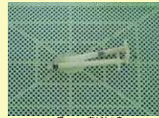
使用済みの注射器

海岸に打ち上げられる海ごみの中には、使用済みの注射器や中身のわからないポリタンク、信号弾（船が救助を呼ぶために打ち上げるもの）などの危険物も混ざっています。こうした危険な海ごみによって、海岸を利用する人や漁をする人がけがをしたり、事故にあうなどの被害も起きています。写真のような危険物を見つけた時は、むやみに近づいて拾おうとしたりせずに、まずは近くにある関係機関まで連絡し、指示に従ってください。