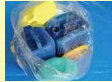
毒性のある液体の入ったポリタンク