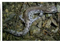
ブチサンショウウオ