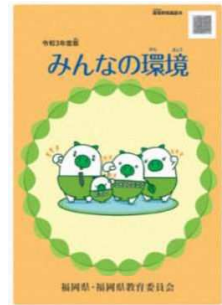
環境教育副読本 「みんなの環境」