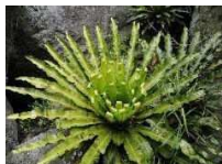
植物 (オオタニワタリ)

動物や植物、細菌などの微生物にいたるまで、様々な生きものが生息・生育していること。