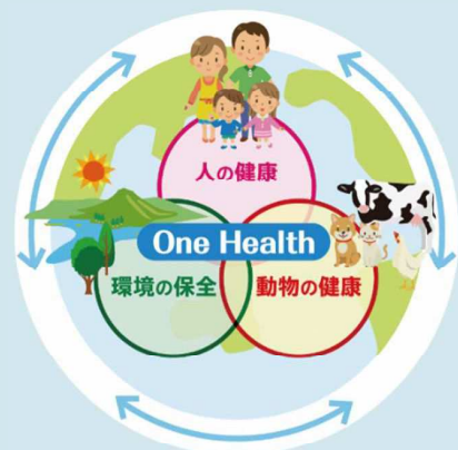
ワンヘルスのイメージ図

このような人と動物、それらを取り巻く環境が直面している様々な課題に対応するため、人と動物の健康と環境の健全性を一つとして捉え、一体的に守ろうというワンヘルスの理念のもと、各分野に携わる者が分野横断的に連携して取り組むワンヘルス・アプローチの考え方が注目されています。