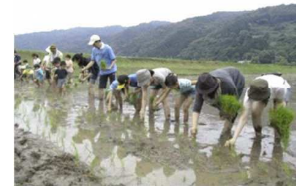
農林漁業体験 （豊前市）