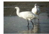
クロツラヘラサギ