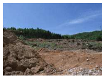
住宅地造成のための森林伐採

沿岸域の埋立てや森林伐採などの開発は、様々な生きものにとって生息・生育環境の破壊や悪化をもたらします。