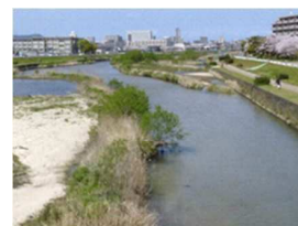
生物多様性に配慮した川づくり（室見川）