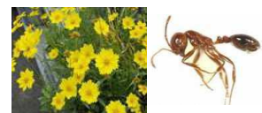
福岡県の侵略的外来種（左：オオキンケイギク、右：ヒアリ）