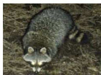
アライグマ (特定外来生物)

外来種や化学物質など、人間が持ち込んだものが生物多様性に悪影響を及ぼすことがあります。特に近年は、外来種が深刻な影響を及ぼす事例が多くみられます。