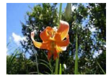
草原に生育するノヒメユリ

農林業の変化や農山村の過疎化に伴い、自然に対する人間の働きかけが縮小することで、数が減ってしまう生きものもいます。