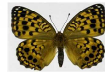
オオウラギンヒョウモン