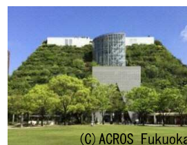
屋上緑化（アクロス福岡）