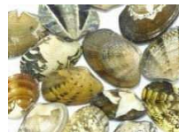
遺伝子の多様性 (アサリ)