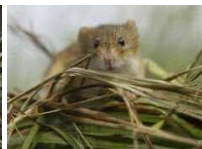
哺乳類 (カヤネズミ)