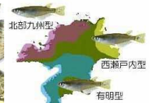
個体群の多様性 (ミナミメダカ)