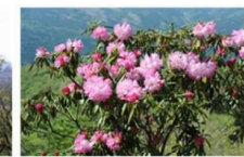
ツクシシャクナゲ