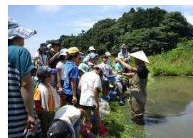
地域環境協議会の取組（出前講座、自然観察会）