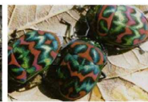
ニシキンカメムシ