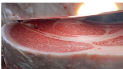
平山氏の金賞受賞牛の枝肉断面

普及指導センターでは今後も関係機関と連携し、飼養管理技術の向上を支援していきます。