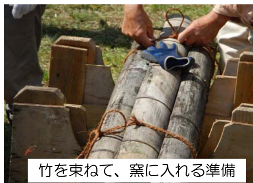
竹を束ねて、窯に入れる準備