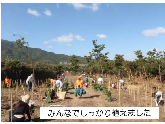
みんなでしっかり植えました