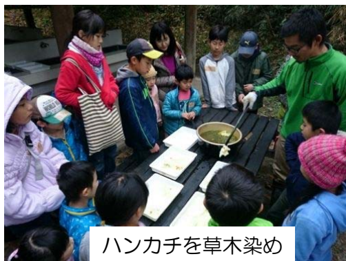
ハンカチを草木染め