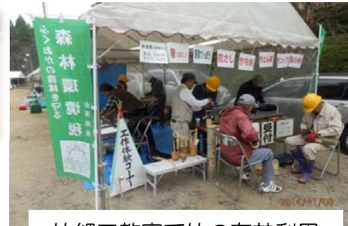
竹細工教室で竹の有効利用