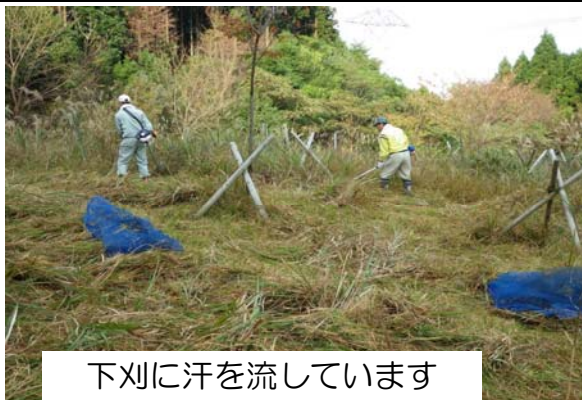
下刈に汗を流しています