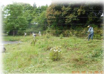
三沢遺跡の森の保全活動