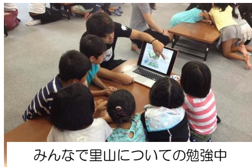
みんなで里山についての勉強中