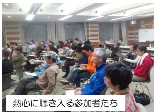
熱心に聴き入る参加者たち