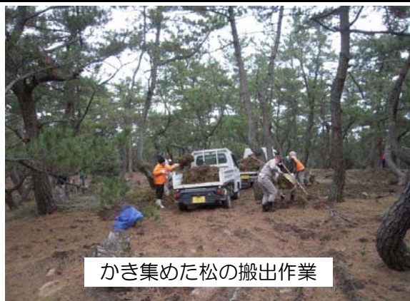
かき集めた松の搬出作業