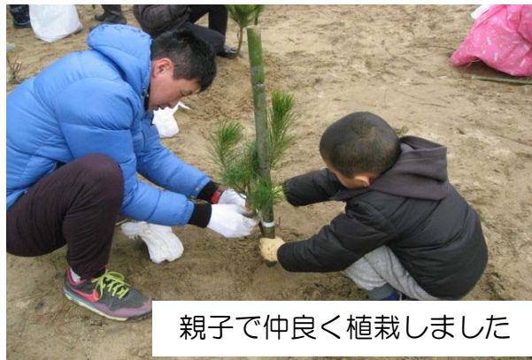
親子で仲良く植栽しました