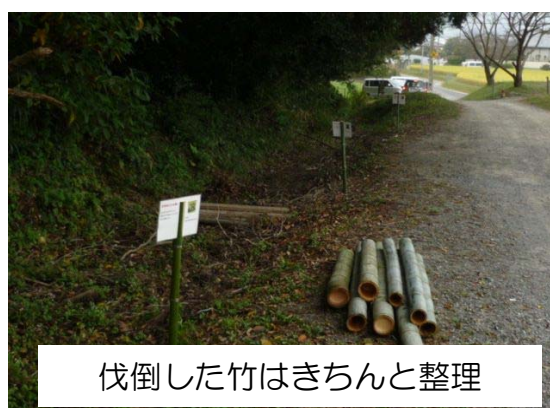
伐倒した竹はきちんと整理