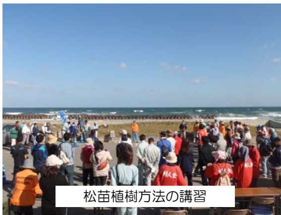
松苗植樹方法の講習