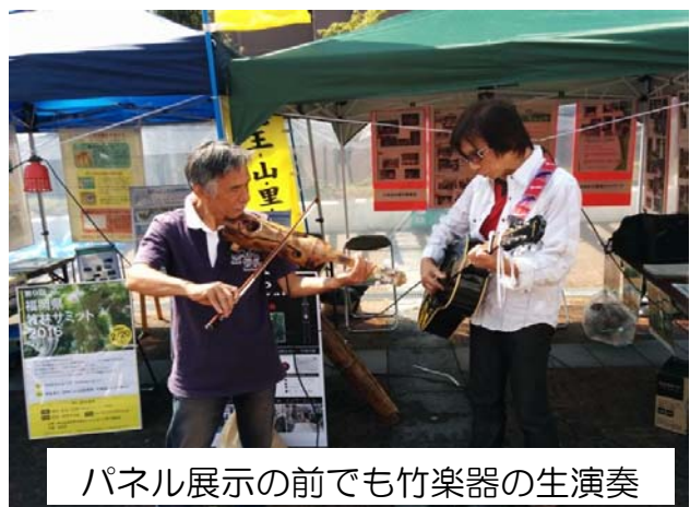
パネル展示の前でも竹楽器の生演奏