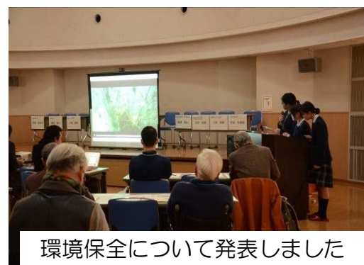
環境保全について発表しました