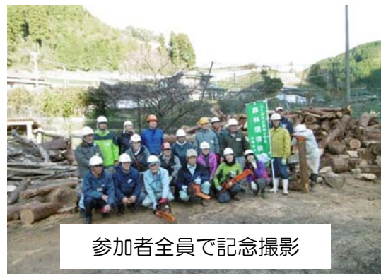
参加者全員で記念撮影