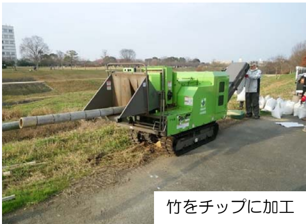
竹をチップに加工