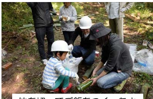
竹を切ってご飯をつくったよ