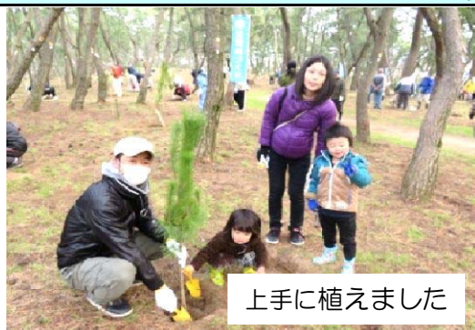
上手に植えました