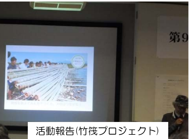
活動報告(竹筏プロジェクト)