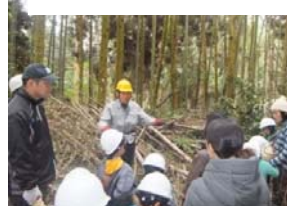
森の仕組みを学び、整備しよう