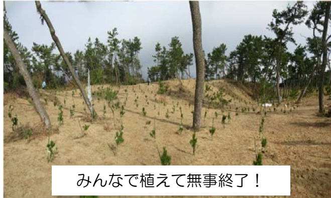
みんなで植えて無事終了！