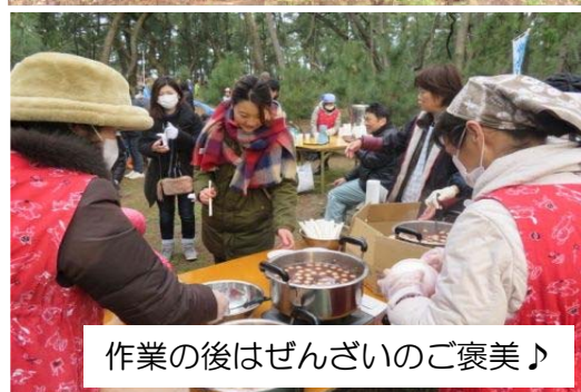
作業の後はぜんざいのご褒美♪