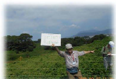
先生が草木の名前を教えてくださいました