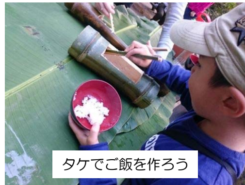
タケでご飯を作ろう