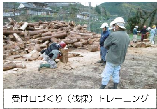
受け口づくり（伐採）トレーニング