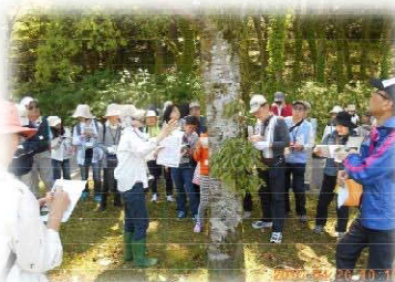
薬草と山野草を見つける会