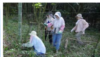
緑を守る下刈、 枝打ち活動