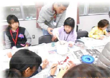
一人づつキャンドルを作った