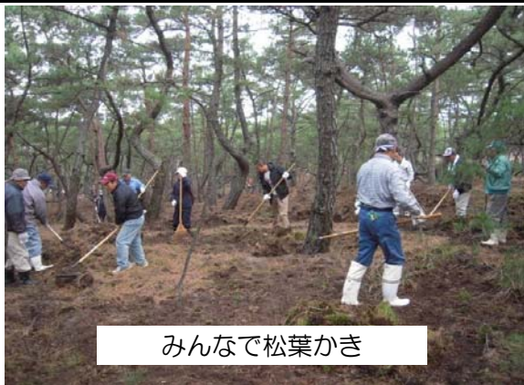
みんなで松葉かき