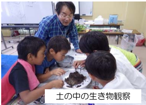
土の中の生き物観察