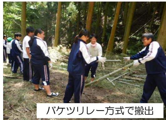
バケツリレー方式で搬出