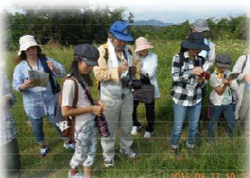
秋の山野草を楽しむ会