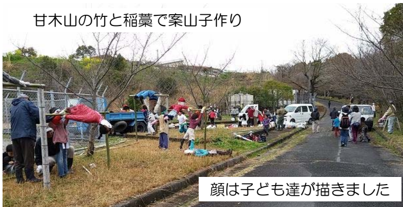
顔は子ども達が描きました