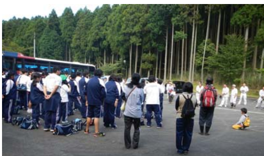
大勢の方が、参加してくれました！