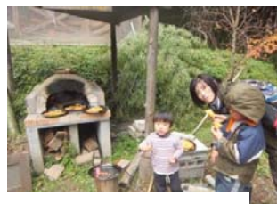
森の中クッキング