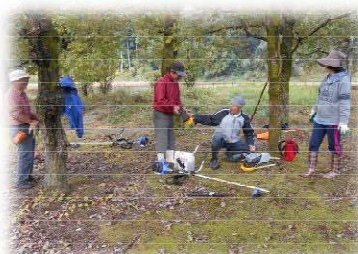
三沢遺跡の森の保全活動