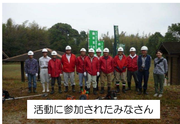
活動に参加されたみなさん