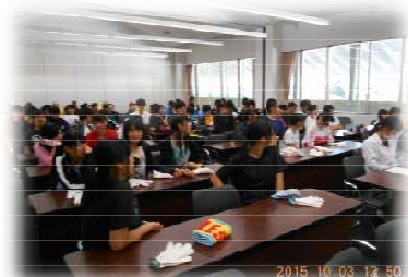
森の保全活動に高校生参加