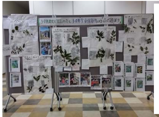
木のカルテと 活動様子の展示