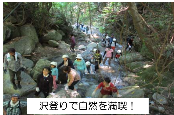
沢登りで自然を満喫！