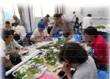
マイツリーの名前を調べた