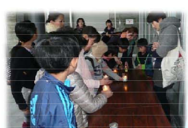
作ったキャンドルに点火した