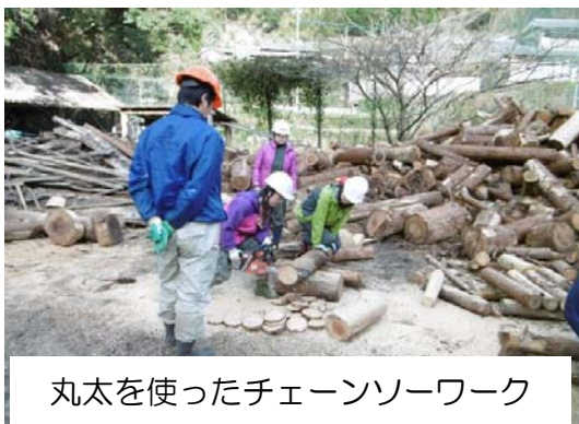
丸太を使ったチェーンソーワーク