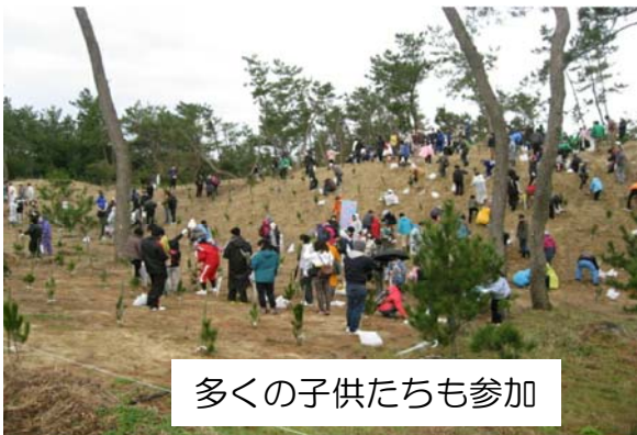
多くの子供たちも参加