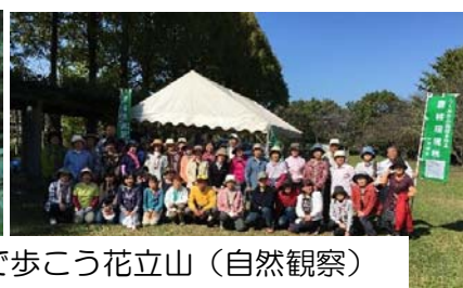
みんなで歩こう花立山 (自然観察)