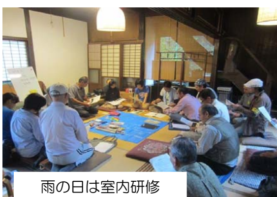
雨の日は室内研修