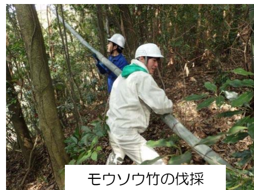
モウソウ竹の伐採