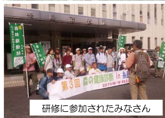
研修に参加されたみなさん