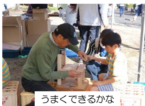
うまくできるかな