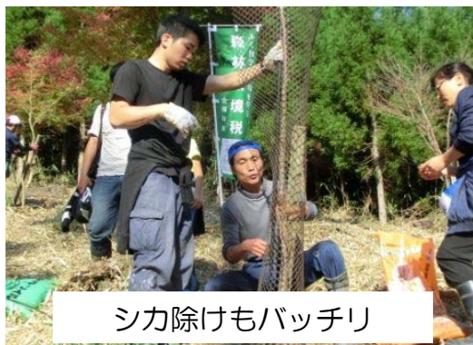
シカ除けもバッチリ