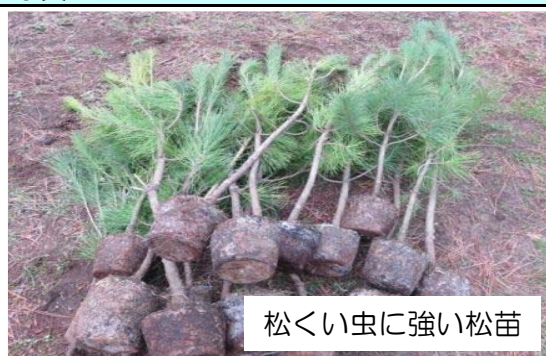
松くい虫に強い松苗