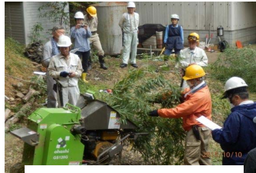
チップパー操作も学びました