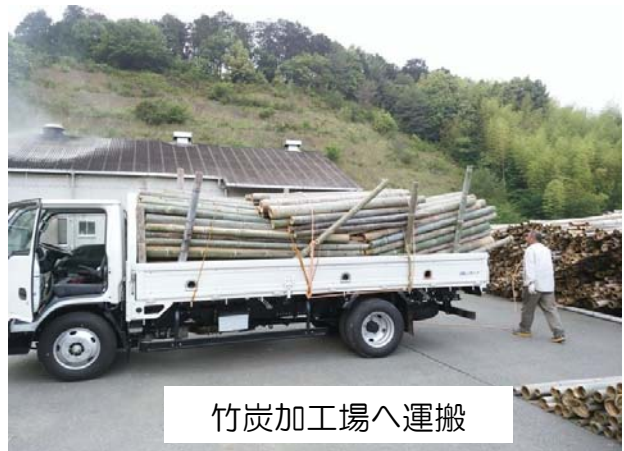
竹炭加工場へ運搬