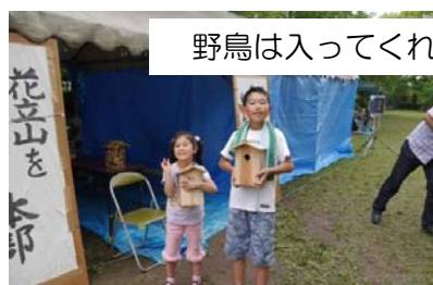
野鳥は入ってくれるかな (巣箱づくり)