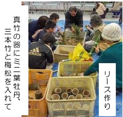
真竹の器にミニ葉牡丹、 三本竹と梅松を入れて