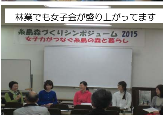
林業でも女子会が盛り上がってます