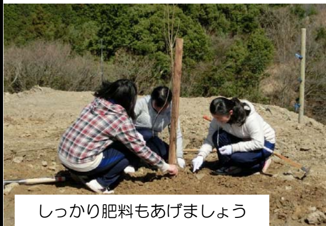
しっかり肥料もあげましょう