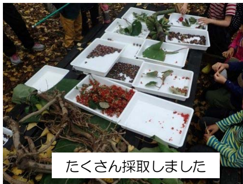
たくさん採取しました