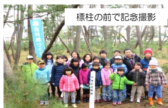
標柱の前で記念撮影