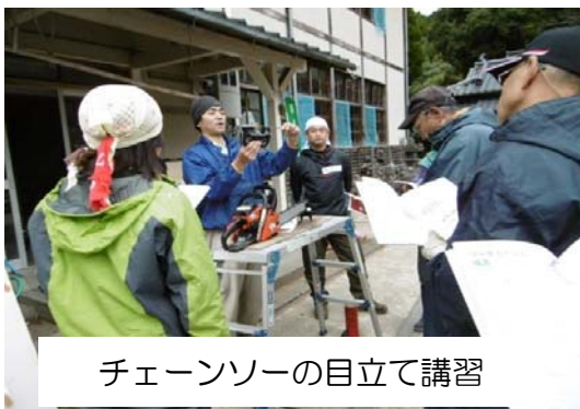
チェーンソーの目立て講習