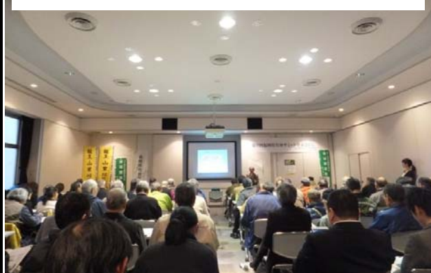
基調講演にもたくさんの方が集まりました