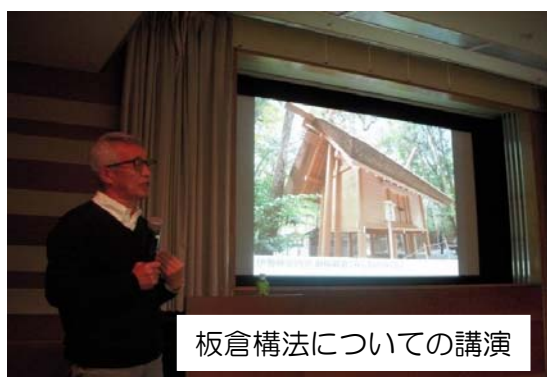
板倉構法についての講演