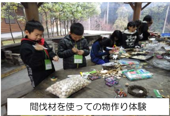
間伐材を使っての物作り体験