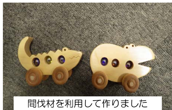
間伐材を利用して作りました