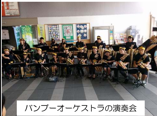
バンブーオーケストラの演奏会