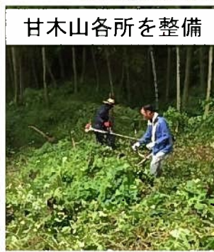
甘木山各所を整備