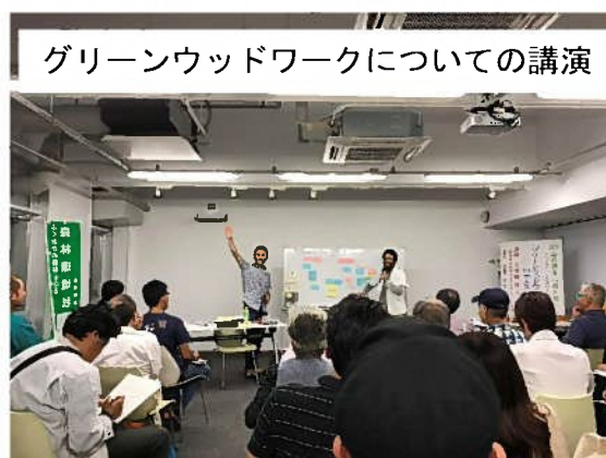
グリーンウッドワークについての講演