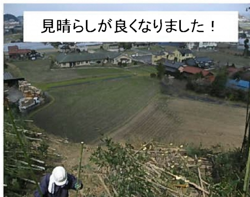
見晴らしが良くなりました！