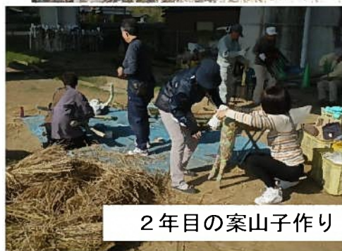
2年目の案山子作り