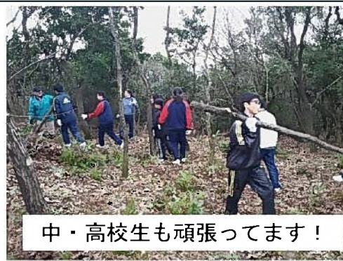
中・高校生も頑張ってます！