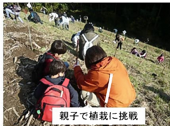
親子で植栽に挑戦