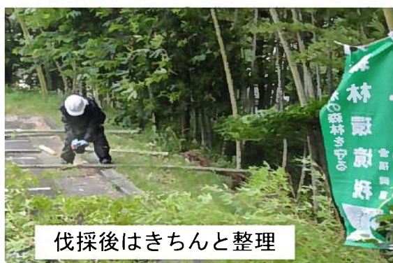
伐採後はきちんと整理