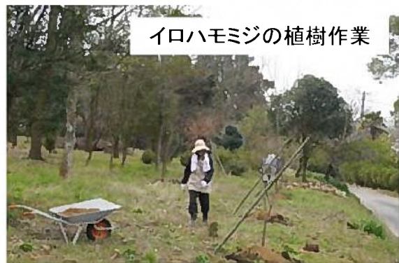
イロハモミジの植樹作業