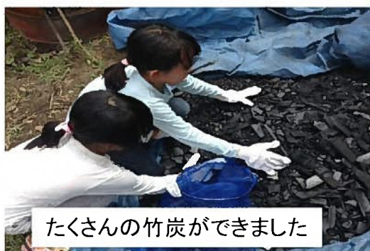
たくさんの竹炭ができました