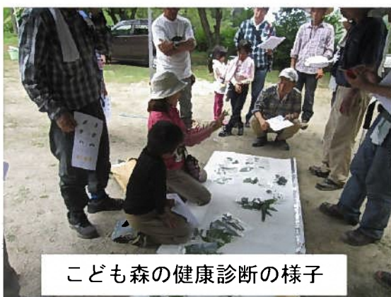
こども森の健康診断の様子