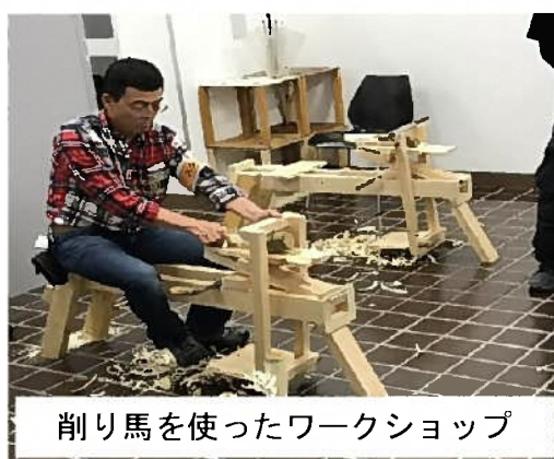
削り馬を使ったワークショップ