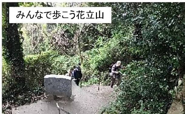
みんなで歩こう花立山