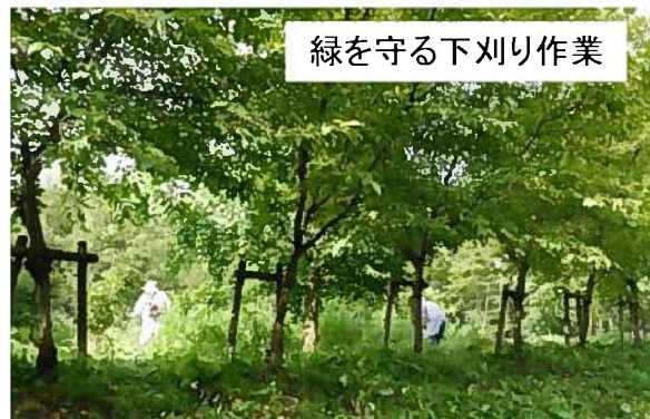
緑を守る下刈り作業