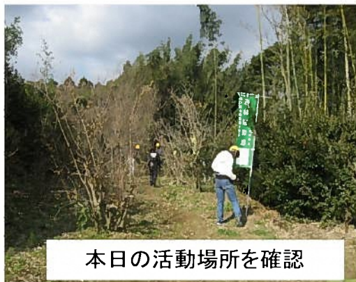
本日の活動場所を確認