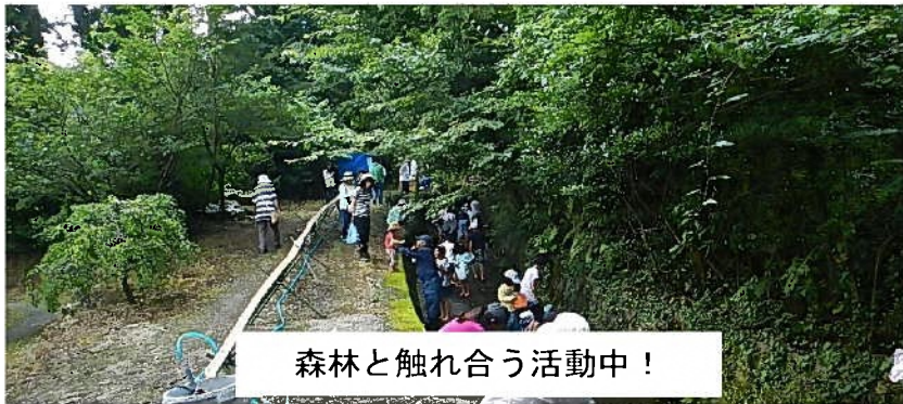
森林と触れ合う活動中！