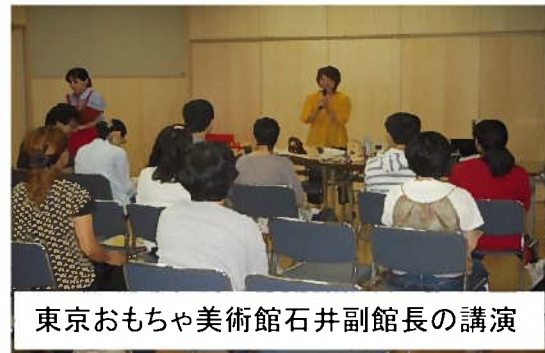
東京おもちゃ美術館石井副館長の講演