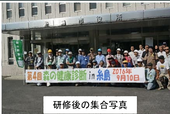
研修後の集合写真