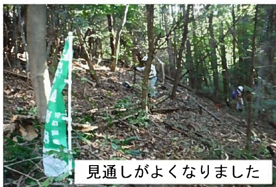
見通しがよくなりました