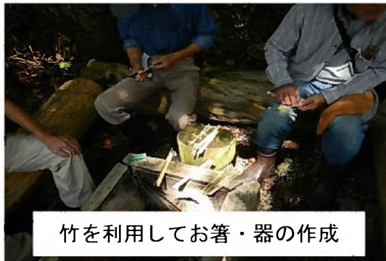
竹を利用してお箸・器の作成