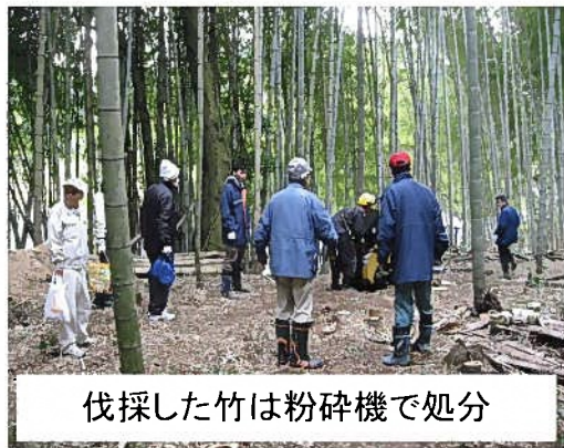
伐採した竹は粉砕機で処分