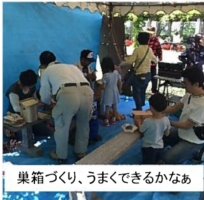
巣箱づくり、うまくできるかなあ