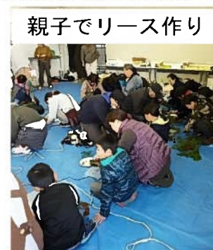
親子でリース作り