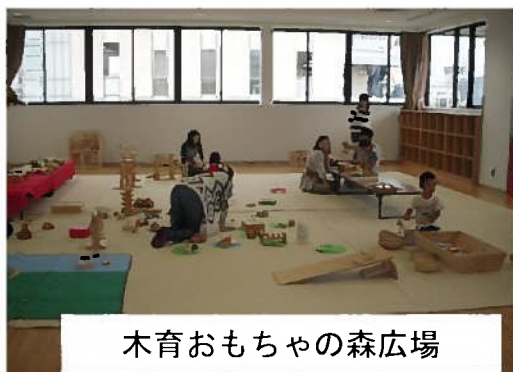
木育おもちゃの森広場