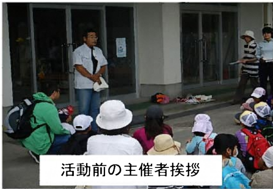
活動前の主催者挨拶