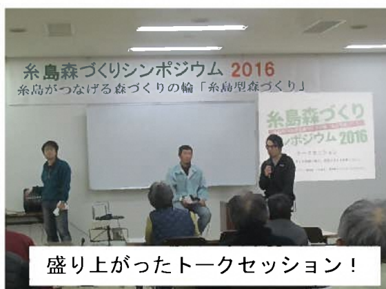
盛り上がったトークセッション！