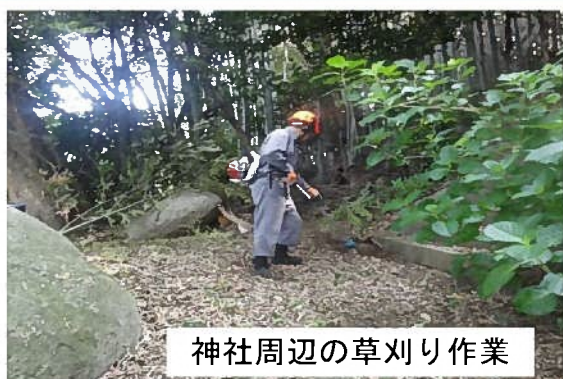
神社周辺の草刈り作業