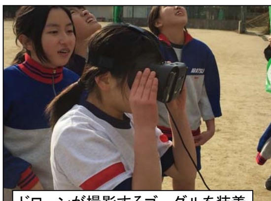
ドローンが撮影するゴーグルを装着