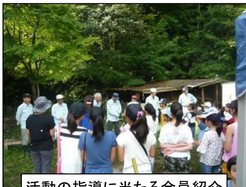
活動の指導に当たる会員紹介