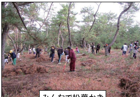
みんなで松葉かき