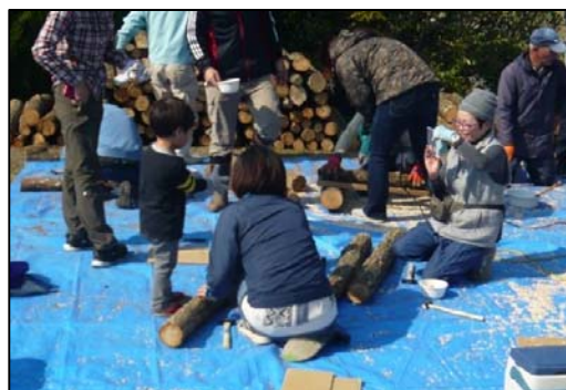
親子で協力して種駒打ち。