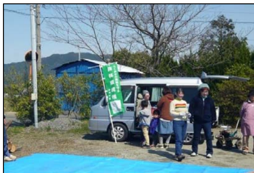
受付開始。林業女子会からも参加あり。