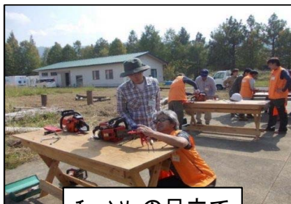
チェーンソーの目立て