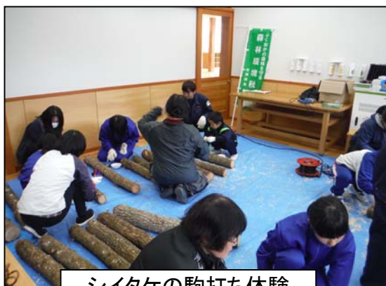
シイタケの駒打ち体験