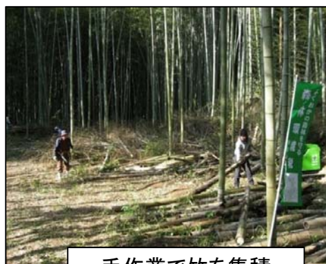
手作業で竹を集積