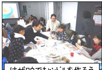
はゼロウでキャンドルを作ろう