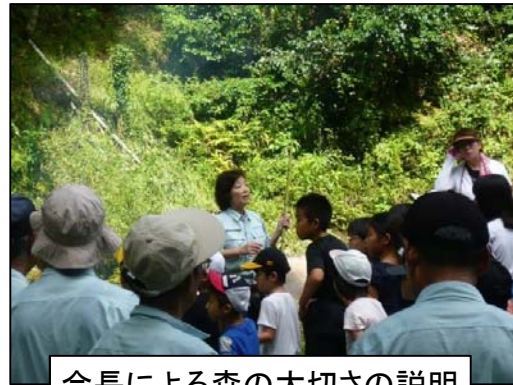
会長による森の大切さの説明