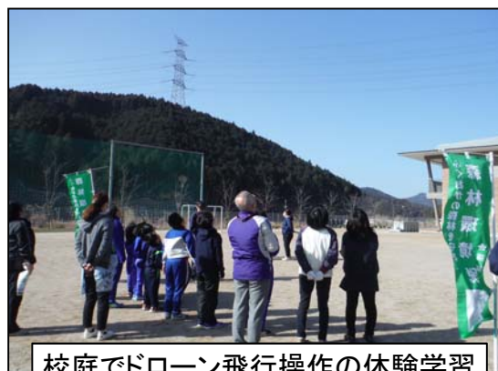
校庭でドローン飛行操作の体験学習