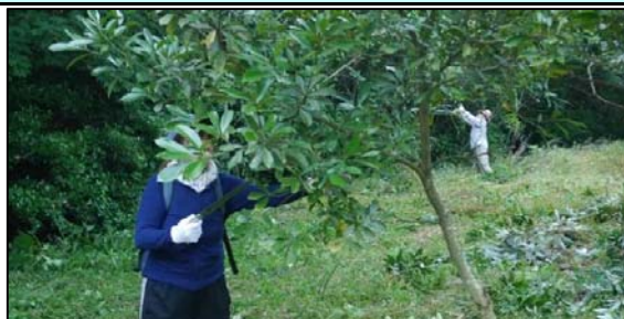
緑を増やす植樹・下刈、枝打ち活動 (森林体験H30. 7. 15)