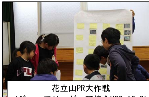
花立山PR大作戦 (ジュニアリーダー研修会H30. 12. 2)