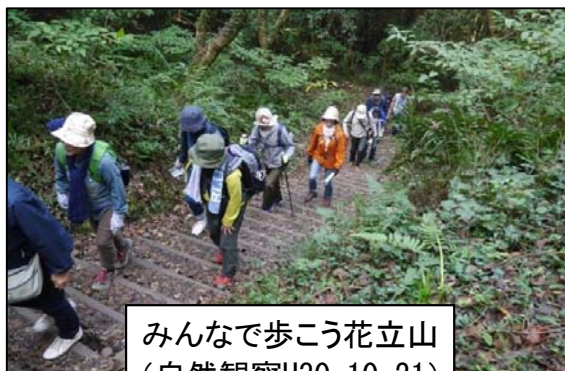
みんなで歩こう花立山 (自然観察H30. 10. 21)