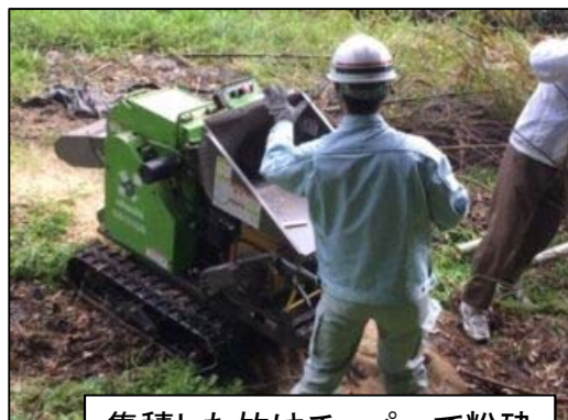
集積した竹はチップパーで粉碎