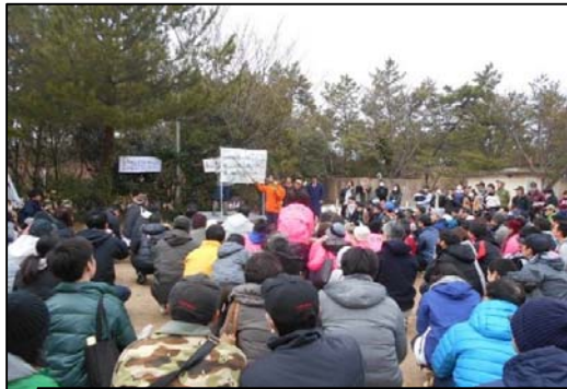
福岡森林管理署が植付方法を説明