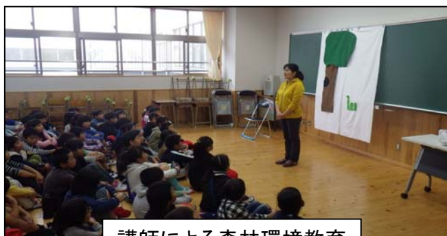
講師による森林環境教育