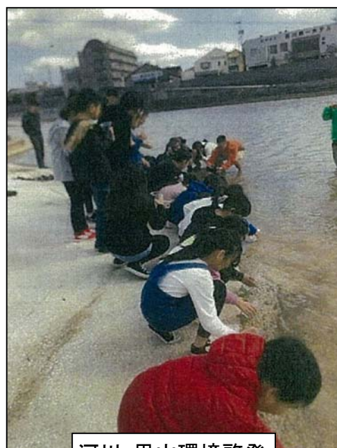
河川・里山環境啓発