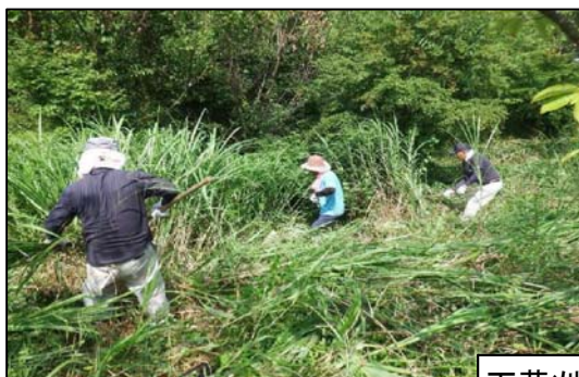
下草刈り活動状況