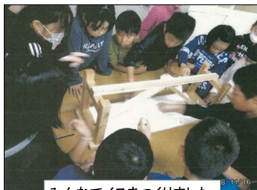
みんなでイスをつくりました