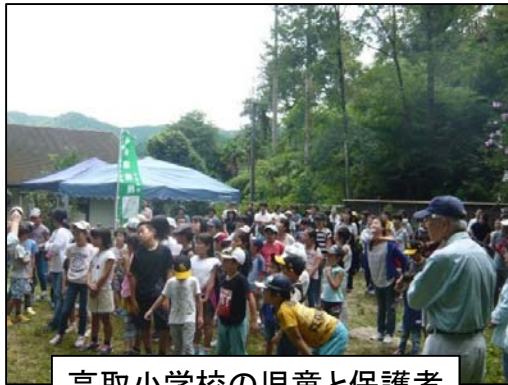
高取小学校の児童と保護者