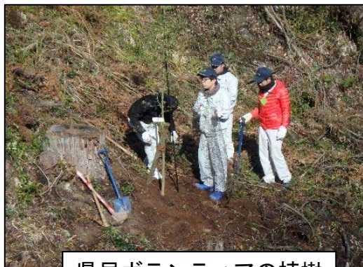
県民ボランティアの植樹