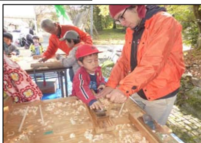
自分で削りました