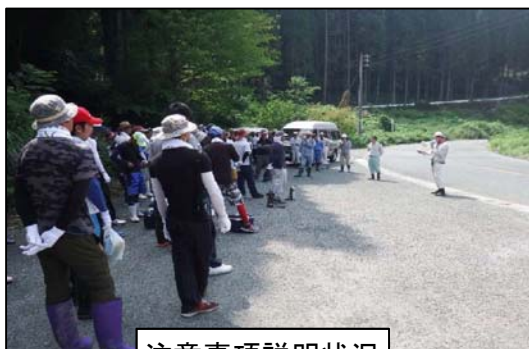
注意事項説明状況