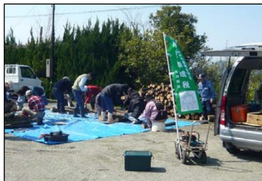
作業開始。準備した原木は200本。