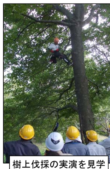
樹上伐採の実演を見学