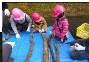
子どもたちも駒打ち