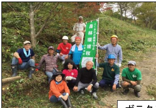
ボラタ森整備活動