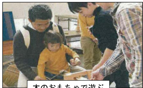
木のおもちゃで遊ぶ