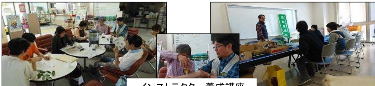
インストラクター養成講座