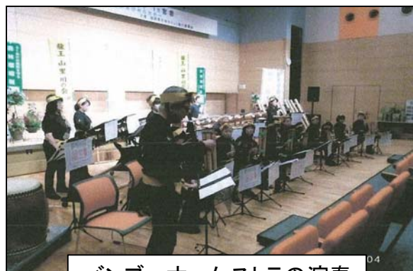
バンブーオーケストラの演奏