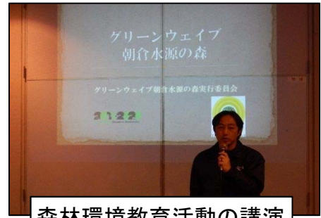
森林環境教育活動の講演