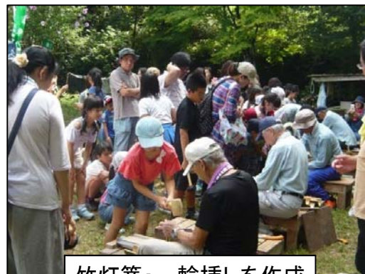
竹灯籠・一輪挿しを作成