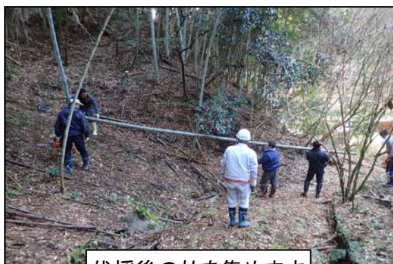
伐採後の竹を集めます