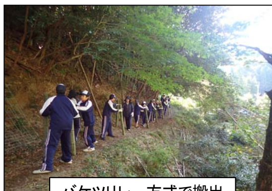
バケツリレー方式で搬出