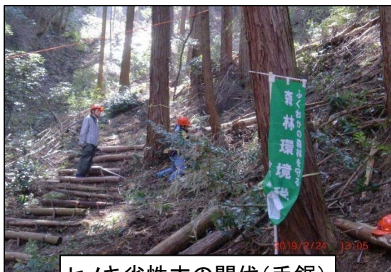
ヒノキ劣性木の間伐(手鋸)