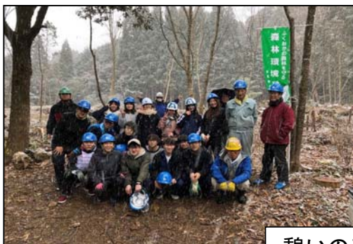
憩いの森整備活動