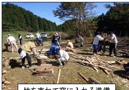
竹を束ねて窯に入れる準備