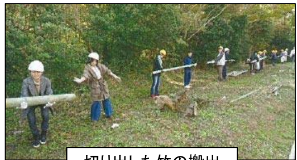
切り出した竹の搬出