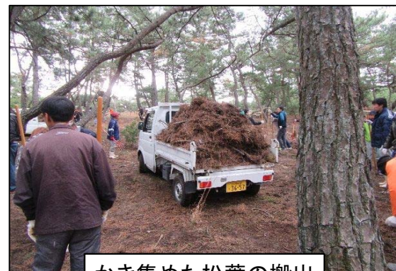
かき集めた松葉の搬出