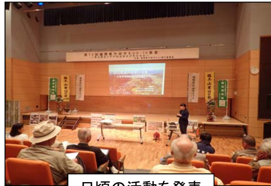
日頃の活動を発表