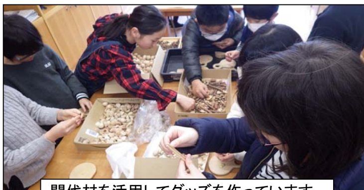
間伐材を活用してグッズを作っています。