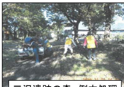
三沢遺跡の森 倒木処理