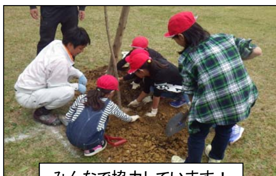
みんなで協力しています！