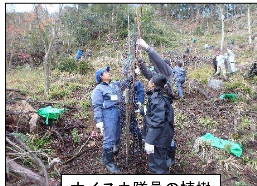
オイスカ隊員の植樹