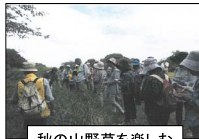
秋の山野草を楽しむ