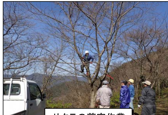
サクラの剪定作業