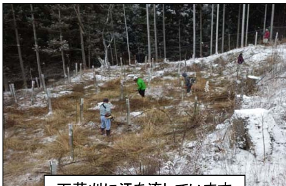
下草刈に汗を流しています