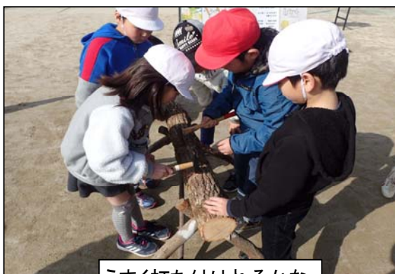
うまく打ち付けれるかな