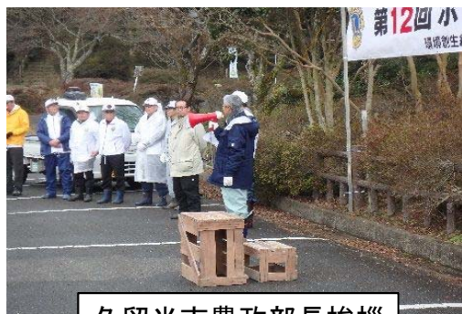
久留米市農政部長挨拶