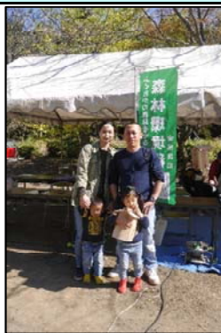
上手につくれました (巣箱づくりH30. 11. 3)