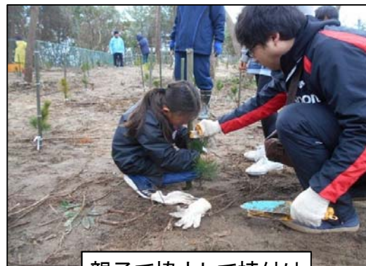
親子で協力して植付け