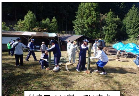
竹を四つに割っています。