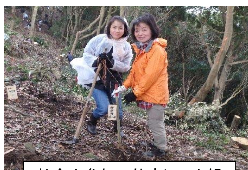
社会人参加の仲良し二人組