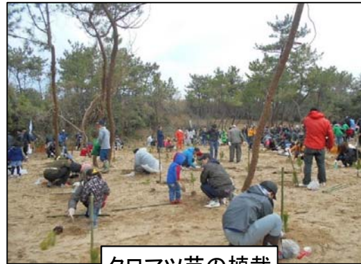
クロマツ苗の植栽