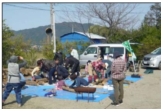
地域住民は子どもも含めて3世代が参加。