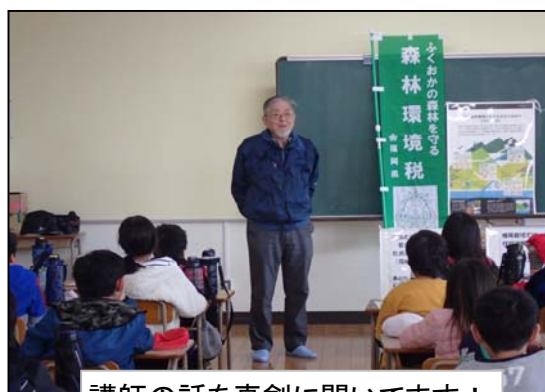
講師の話を真剣に聞いてます！