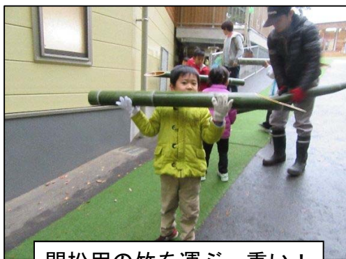
門松用の竹を運ぶ。重い！