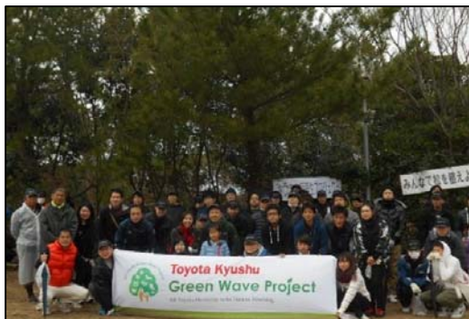
地域住民・地元企業約400名が参加