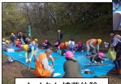
シイタケ植菌体験