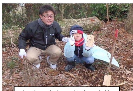
社会人参加の仲良し家族