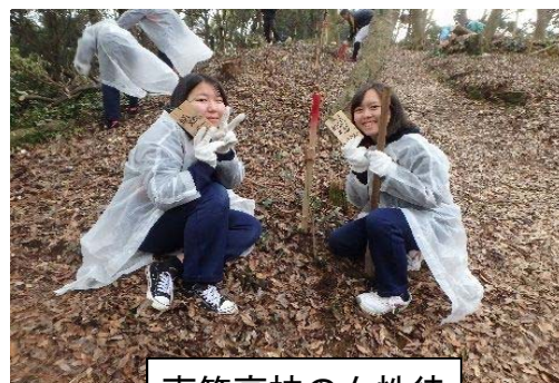
南筑高校の女性徒