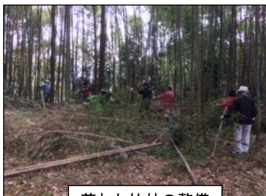
荒れた竹林の整備