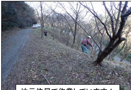
地元住民で作業しています！