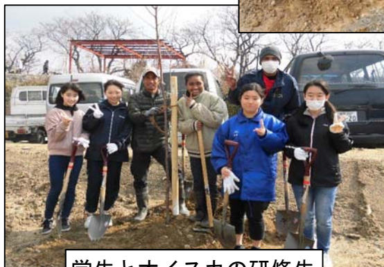
学生とオイスカの研修生