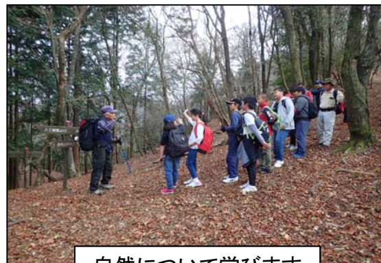
自然について学びます