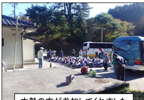
大勢の方が参加してくれました