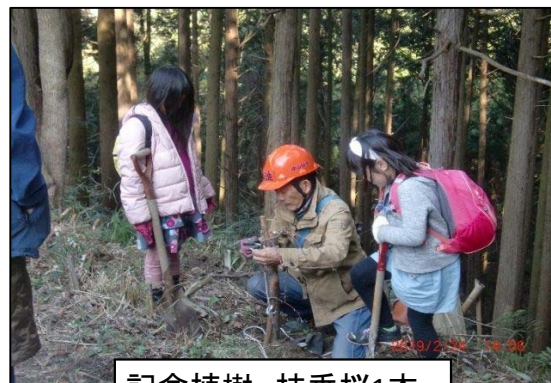
記念植樹。枝垂桜1本。