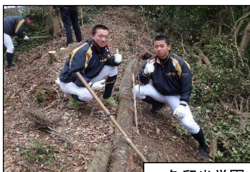
久留米学園・南筑高校の生徒たち