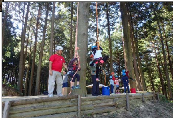
ツリークライミング