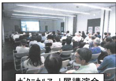
ボタニカルアート展講演会