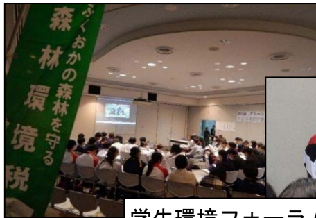
学生環境フォーラム