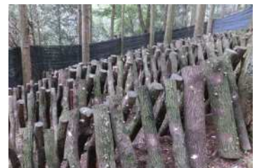
ほだ場の防獣設備