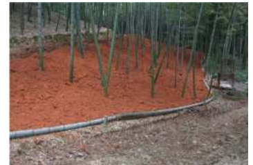
客土による竹林の改良