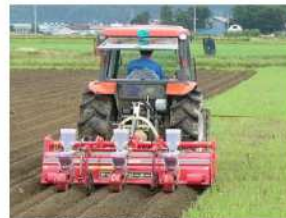
播種同時うね立て