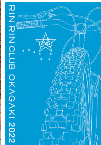
ポスターデザイン