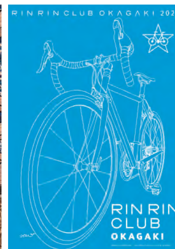
イラストはイメージです