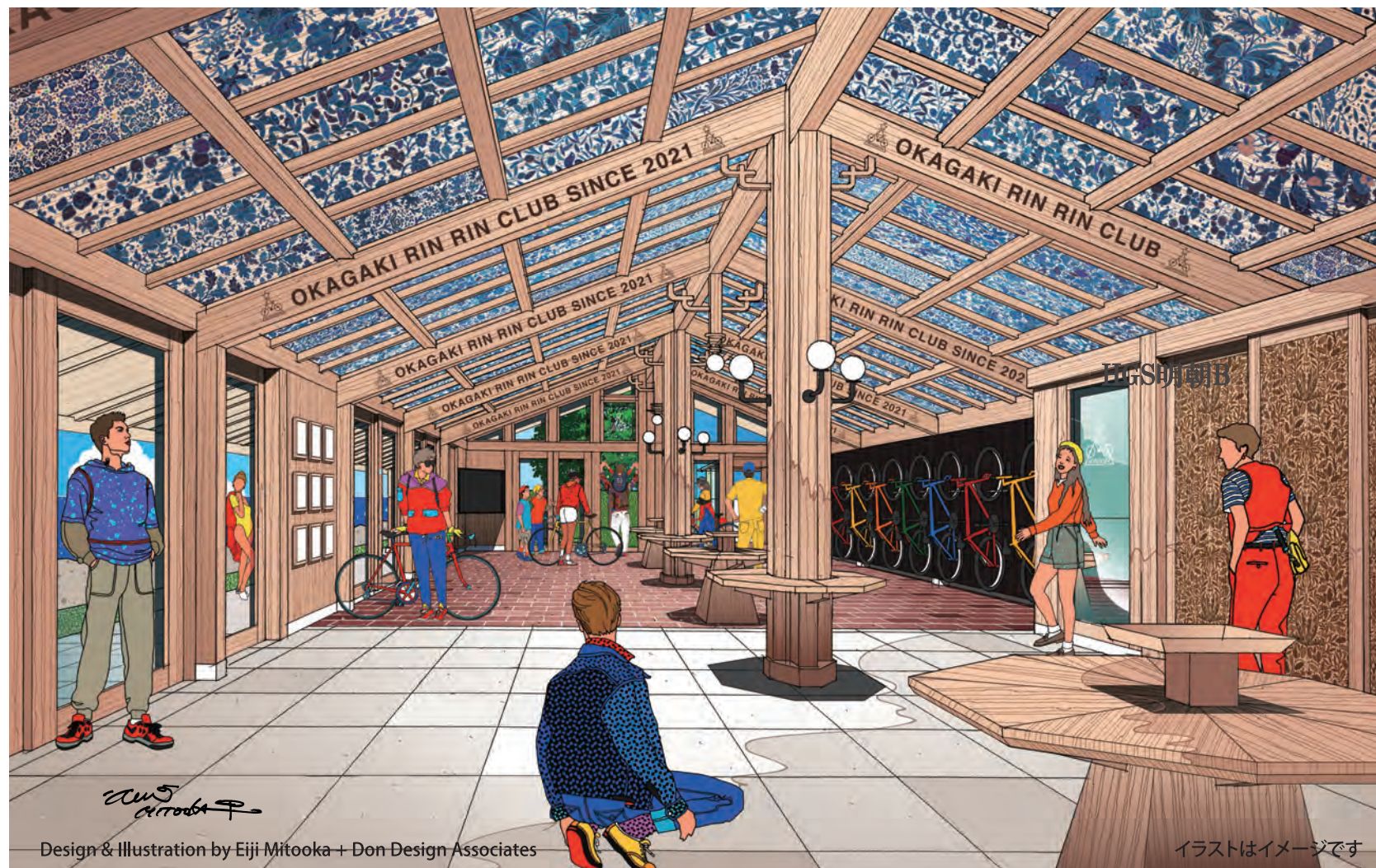
Design & Illustration by Eiji Mitooka + Don Design Associates