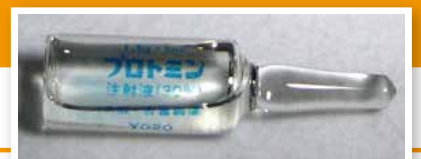
プロミン(注射薬)

c 有効な治療薬プロミンが開発されるまでは、発病すると病気が進行してしまい、不治の病と考えられていました。