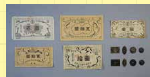
園内通用券(多摩全生園)