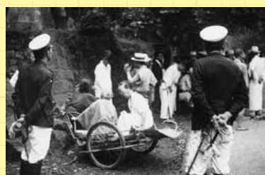
ハンセン病と診断された患者は強制的に療養所に入所させられました。